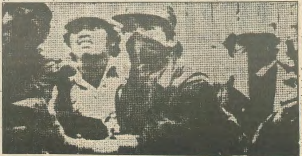
Όχρωμένοι σε ένα χαράκωμα αντάρτες «Σαντινιστας» στη Νικαράγκουα, αγωνίζονται για την ανατροπή του Σομόζα.

ενώ μερικές ανάμεσα στις οποίες η δεύτερη σε πληθυσμο πόλη της χώρας, η Λεον, βρίσκονται στα χέρια των ανταρτων. Στα νότια, κοντα στα σύνορα με την Κόστα Ρίκα οι Σαντινιστες ελέγχουν μια μεγάλη λωρίδα που η Εθνοφυλακή απότυχε ν' ανακαταλάβει παρα τις επίμονες προσπάθειες της.