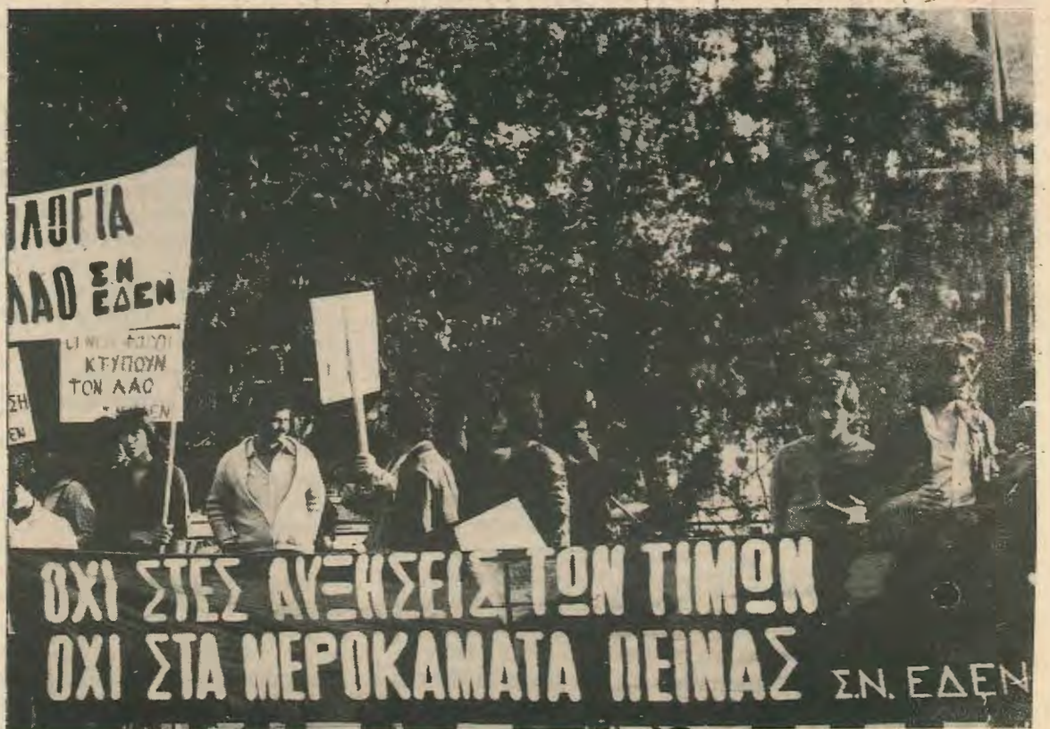
Απο την πικεττοφορία της ΕΔΕΝ ενάντια στη νέα φορολογία ρεπορταζ στη σελ. 2