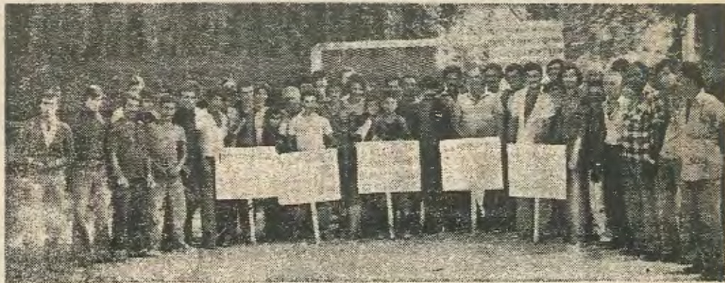
Αναβάτες και σταυλίτες του Ιπποδρόμου

Ιδιοκτητών σχετικά με την αφαίρεση των τροφών των αλόγων.