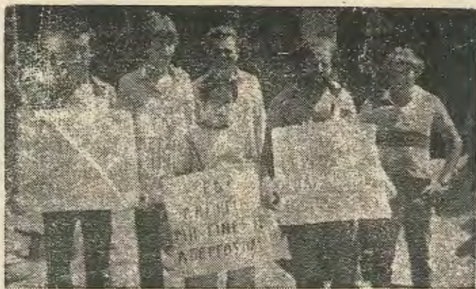
Οι απεργοί οικοδόμοι του Σ. Ράφτη

Αποτέλεσμα αυτής της στάσης της εργοδοσίας ήταν οι 30 οικοδόμοι να κατέλ-