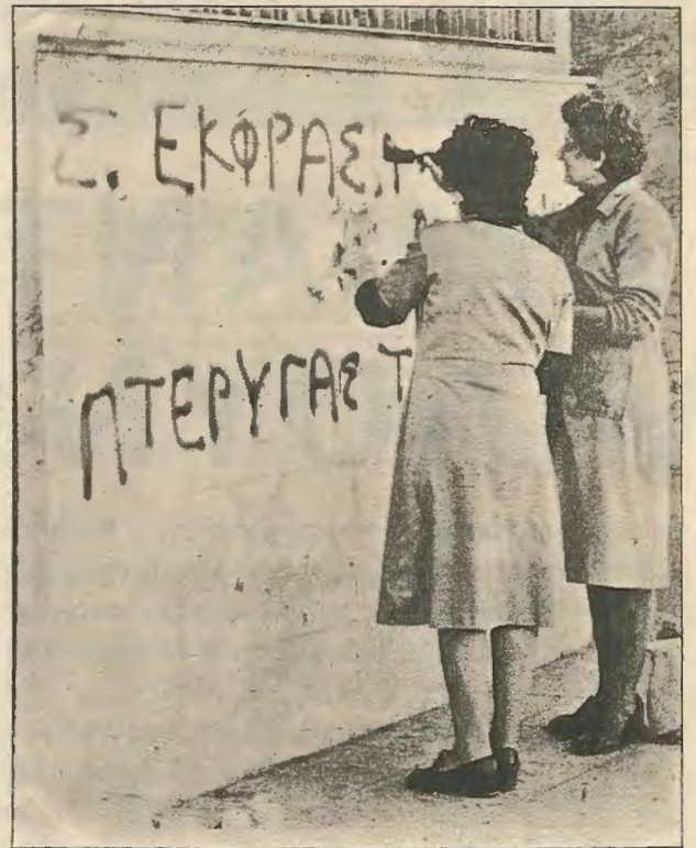
Nicosia Mayor Lellos Demetriades has appealed to all civic-minded citizens to help stamp out the "ugly" habit of painting slogans on the walls of private and public buildings and ancient monuments. Picture shows two women workers cleaning slogans from the marble front of Barclays Bank in Eleftheria Square, Nicosia. It took them a whole day.