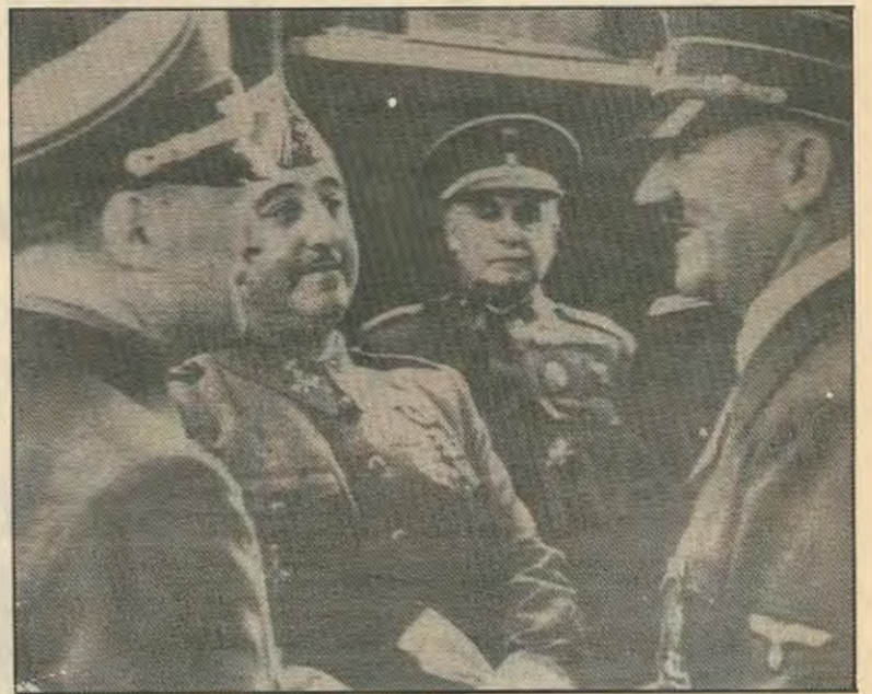
Πίσω απ' τον Φράγκο, το Μουσολίνι, το Χίτλερ και άλλους, οι ίδιοι πάντα, Οι ίδιοι πάντα καπιταλιστες στόχο τους έχουν εσένα εργάτη (Λ. Κηλαηδόνη, «απλα μαθήματα πολιτικής οικονομίας»)

Η ανάπτυξη των Μαρξιστικών δυνάμεων μέσα στις συντεχνίες και μέσα στο Σοσιαλιστικό Εργατικό Κόμμα (το 1979 ο αρχηγος του Γκονζάλες απότυχε σε συνέδριο να αφαιρέσει απο το καταστατικό του κόμματος αναφορά στο Μαρξισμό) και το κομμουνιστικό κόμμα, παρα τη δεξιά στροφή της ηγεσίας αυτών των κομμάτων, είναι μια μόνο ένδειξη πως