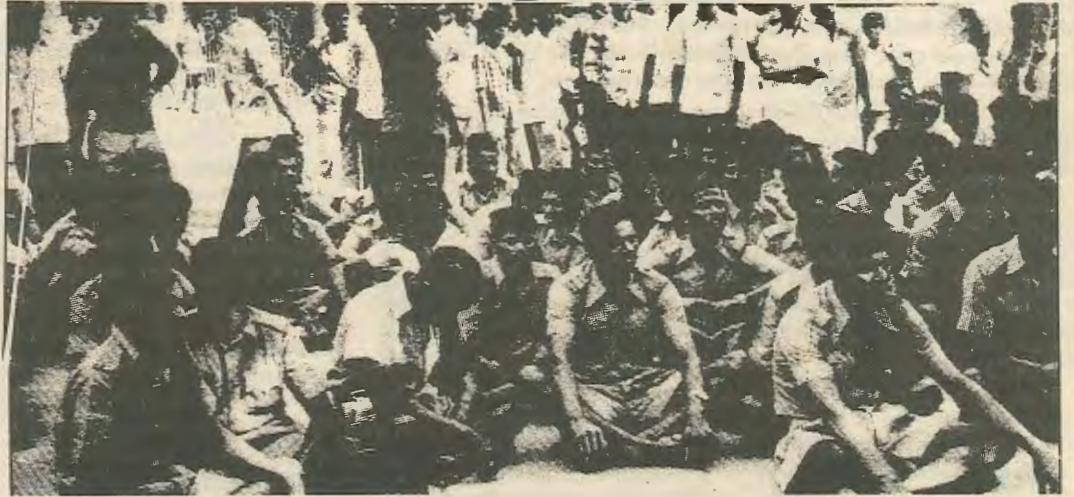
Αστυνομικοί κατά την απεργία του '79. Για να σπάσει η απεργία χρειάστηκαν οι σφαίρες του στρατού

Στις 18 του Αυγούστου 1982 η πλειοψηφία των αστυνομικών της Βομβάης — γύρω στις 22.000 — κατέβηκαν σε απεργία διαμαρτυρίας για τη σύλληψη 20 ηγετών της Συντεχνίας των Αστυνομικών και την απόλυση