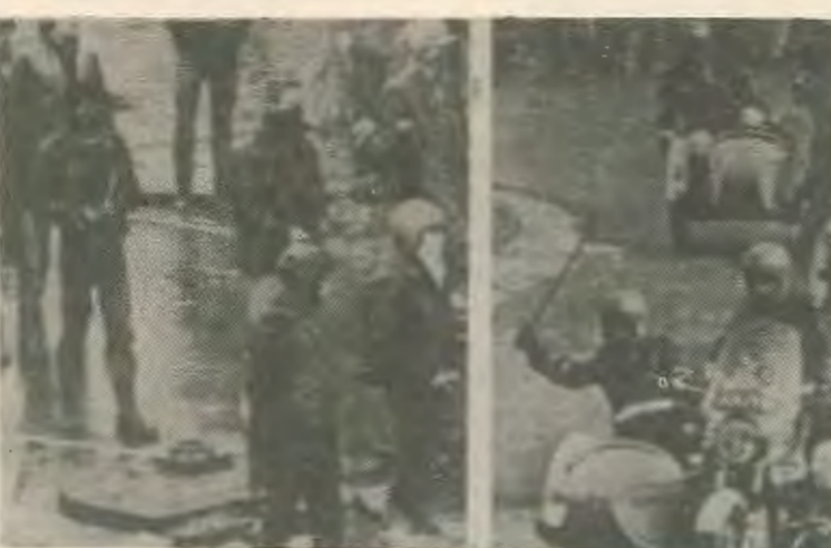
Απο τη γενική ανεργία στο Βέλγιο