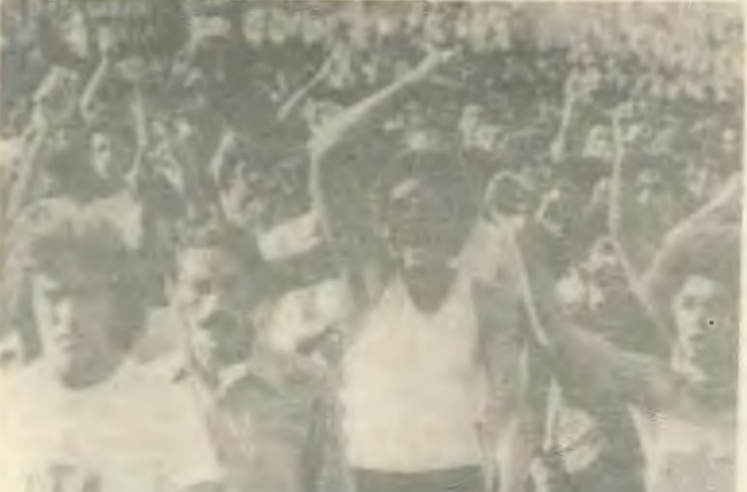
Απεργία εργατων μετάλλου στο Σάο Πάολο (Βραζιλία)

Αυτή ήταν και η ουσία της αυτοδύλωσης της Χούντας της Αργεντινής. Από τη μια ήταν η χρεωκοπία της μονεταριστικής τους πολιτικής: