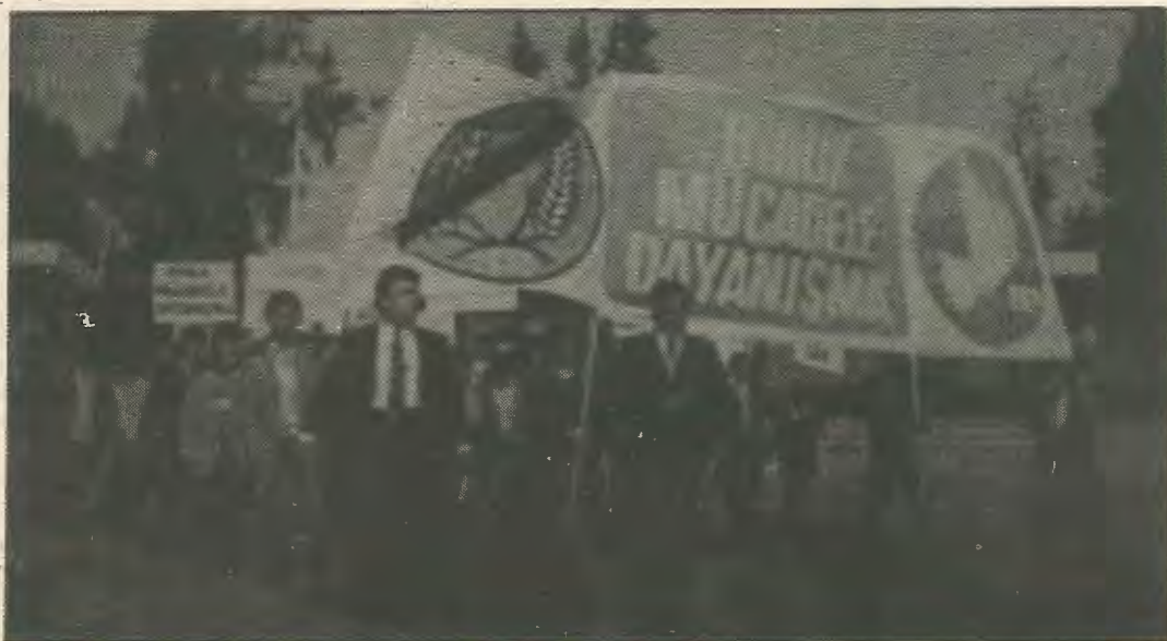
Ογκιουρ και Μποζγκουρτ μπροστα από κοίνο πανώ των δυο αριστερών κομμάτων