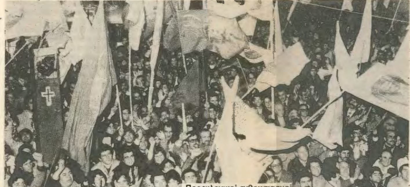
Προεκλογικοί ενθουσιασμοί - μετεκλογικοί θρήναμοί - Πολύ σύντομα η κοινοπραξία θα βρεθεί σε κρίση όπως σωστά πρόβλεψε η Σ. Έκφραση

Πίστη στο σύστημα Η παρουσία της ΕΔΕΚ στην Κύπρο έγινε υπεριοικτική. Αντι να κεραιθόνε τη πολιτική της στη μεριά της δημιουργίας ενιαίου μετώπου της αριστερας χτυπούσε απο τα δεξιά κατηγορώντας το ΔΗΚΟ για τη συνεργασία με το ΑΚΕΛ. Αφτή η πολιτική την αποξένωνε συνέχεια απο τις εργατικές μάχες.