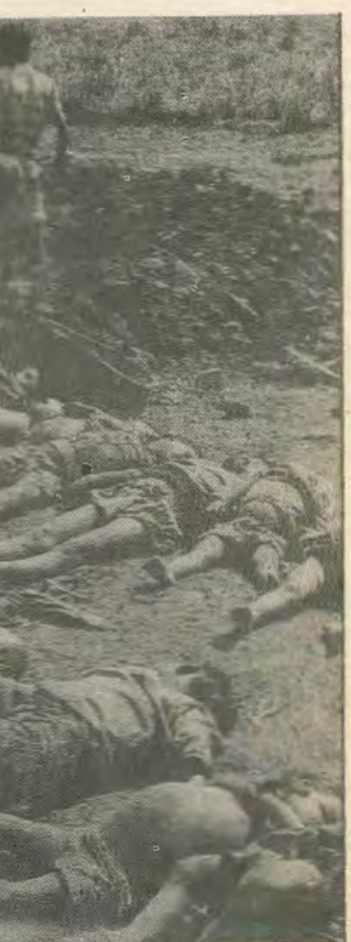
Απο τις σφαγές στο Ασσομ

Οι συγκρούσεις έφθγγαν από τα χέρια της κυβέρνησης και κόνταναν να ισοπεδώσουν το Κολόμφο κι άλλες πόλεις, για να επιβληθεί τελικά κατάσταση ε-