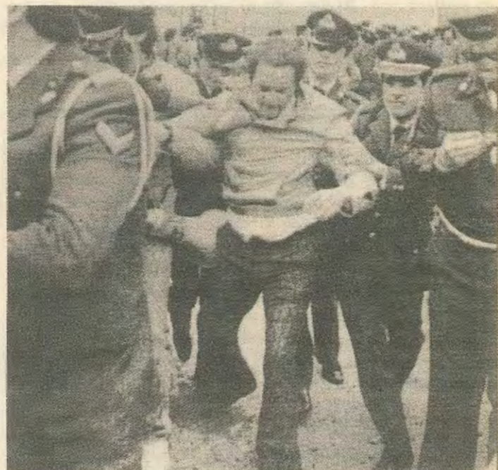
Ένα στιγμιότυπο απο τη σημερινή Ελλάδα του ΠΑΣΟΚ.

Αλλά το ζήτημα δεν βρίσκεται στα μαγερέβματα, στα παζάρια, τους συμβιβασμούς και τα ξεπουλήματα. Βρίσκεται στο συσχετισμό ταξικών δυνάμεων. Η εργατική τάξη προσφέρει στο ΠΑΣΟΚ τη δύναμη της, τις διαθέσεις της,