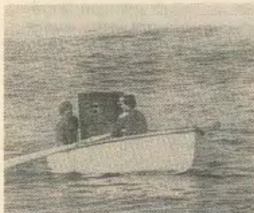
ηγείτο της παράνομης οργάνωσης Ε.Ο.Κ.Α.—Β.

Η Κυβέρνηση σαν γνήσιος εκπρόσωπος της δεξιάς προσπαθεί να ταυτίσει τον Γρίβα με τον απελευθερωτικό αγώνα του 55-59 και να παραγνώρισει τις φασιστικές-του δραστηριότητες, όπου σαν αρχηγός της οργάνωσης «Χ» στην Ελλάδα καθοδηγούσε σε συνεργασία με τους Άγγλους τις εχτελέσεις ανταρτων αγωνιστών του Ελληνικού Λαϊκού Απελευθερωτικού Στρατου (ΕΛΛΑΣ) που πάλευαν ενάντια στα φασιστικά στρατεύματα του Χίτλερ. Μετέπειτα στην Κύπρο