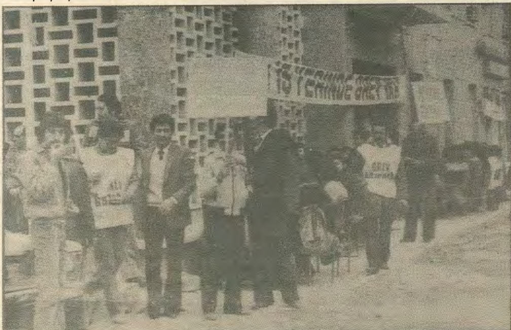
Απο τη Γενικη Απεργία που παράλυσε τα πάντα.