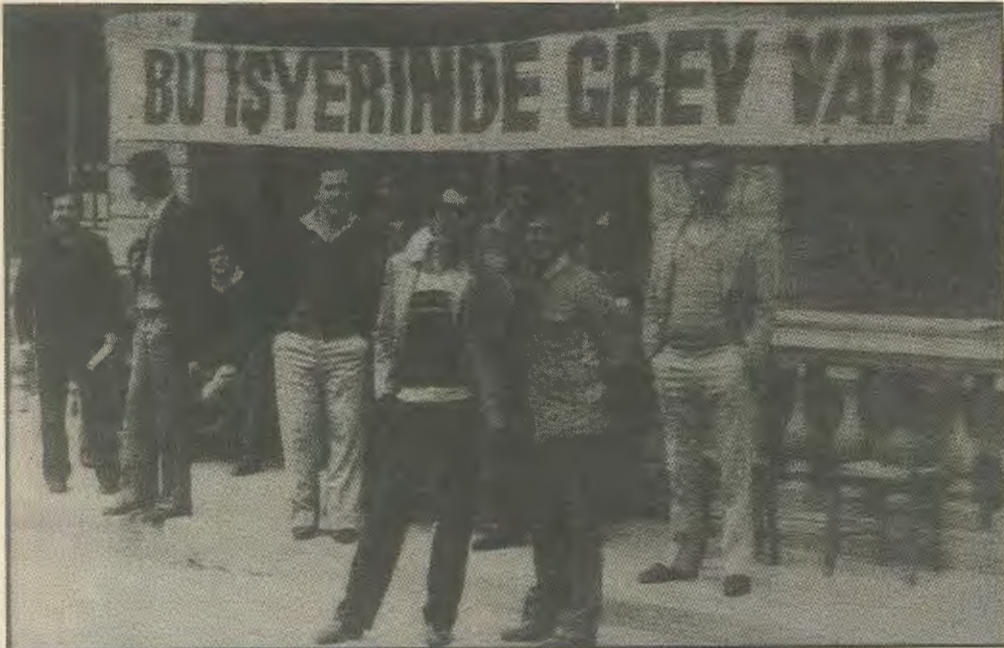
Στιγμιότυπο από την απεργία.