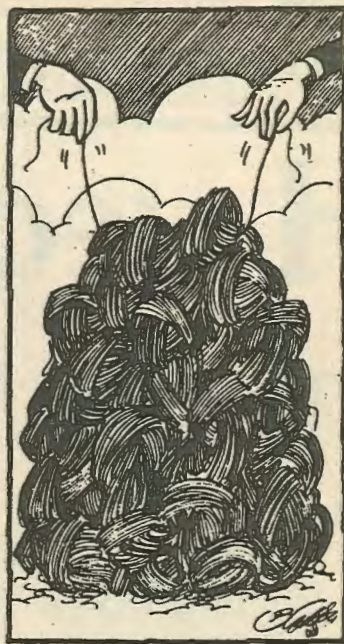
Οι Ε/Κ και Τ/Κ αστοί προσπαθούν να λύσουν το Κυπριακό.

Αλλά κι αν ακόμα, κάτω από την πίεση της εργατικής τάξης πάνω στο οικονομικό και κοινωνικό επίπεδο, καταλήξουν σε κάποια λύση, θα είναι λύση με στόχο την συγκράτηση της εργατικής τάξης. Ένας στόχος που μπορεί πρόσκαιρα να έχει σχετική επιτυχία μα που πολύ σύντομα θα φέρει αντίθετα αποτελέσματα. Μετα από μια περίοδο αναπροσαρμογής, η