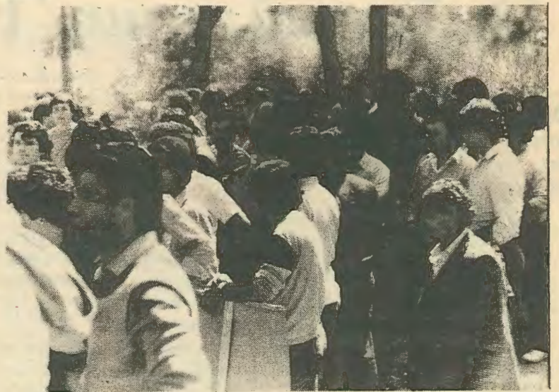
Οι εργάτες στο προεδρικό τον περασμένο Απρίλη.

Άλλη λύση για τους εργάτες δεν υπάρχει. Η Ε.Μ.Ε., οι Ε.Χ.Β., τα μονοπώλια, τα διύλιστήρια, οι τράπεζες κι άλλοι ζωτικοί τομείς της οικονομίας είναι τόσο αποφασιστικοί για την οικονομία που δεν μπορούν να