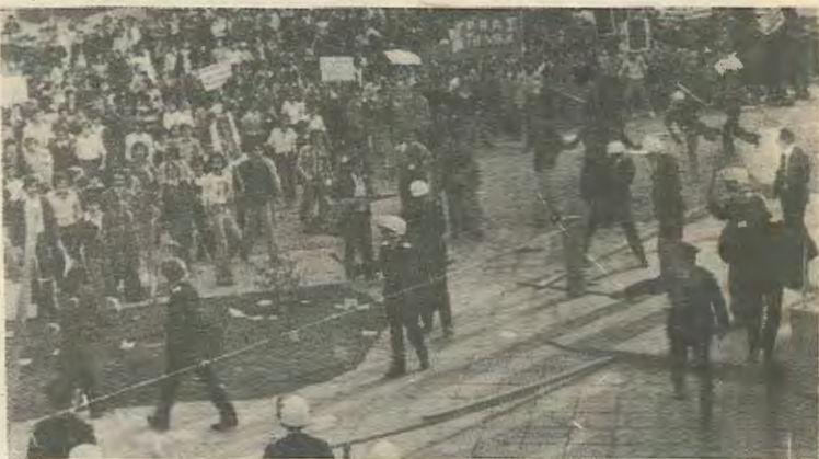
Η νεολαία στην πρωτοπορεία του αγώνα μετά το πραξικόπημα

το πρόβλημα της ανεργίας, ο στρατος το αδιέξοδο στο εθνικο θέμα είναι προβλήματα πουηγάζουν από το ίδιο το καπιταλιστικο σύστημα. Ότι με την αδιαφορία την οποία δείχνει όχι μόνο δεν λύνονται τα προβλήματα τους αλλά διαιωνίζονται ότι παίζει και το παιγνίδι της άρχουσας αστικής τάξης που θέλει τη νεολαία όχι επαναστατική αλλά άβουλη, αδιάφορη, αναποφά-