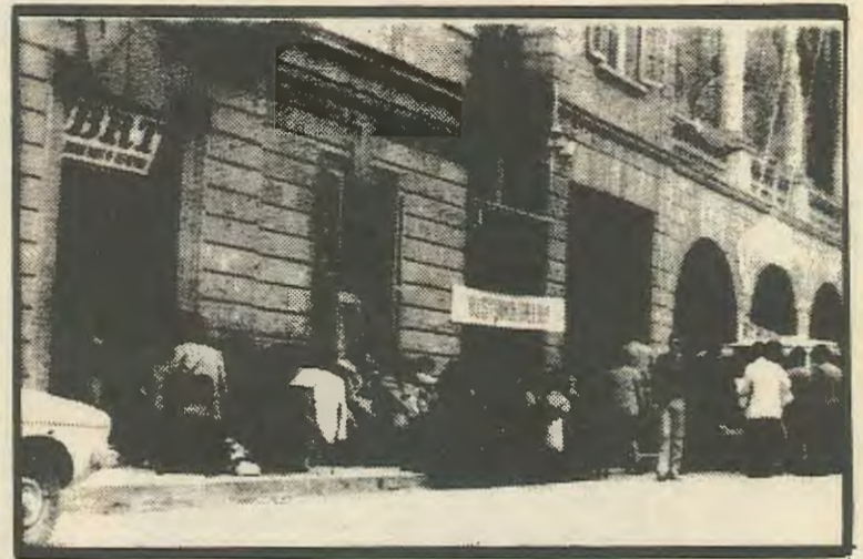
Ακόμα και ο ραδιοσταθμός έκλεισε.