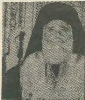
από τα δεσμά της ολιγαρχίας όποιος κι αν είναι.

Φυσικά δεν συμφέρει κι όλας να τα καταλαβαίνουν όλα αυτά γιατί μετά πως θα καμαρώνουν σαν παγώνια. Όμως, ο εργαζόμενος, που δουλεύει μέρα νύκτα για να μεγαλώσει τη φαμίλια του κάποτε θα βρει τον τρόπο να πετάξει από το σβέρκο του τον κάθε εκμεταλλευτή. Αυτό είναι και το καθήκον των αριστερών κομμάτων ν' απελευθερώσουν την κοινωνία