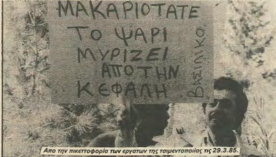
Απο την πικετοφορία των εργατων της τσιμεντοποιίας τις 29.3.85.