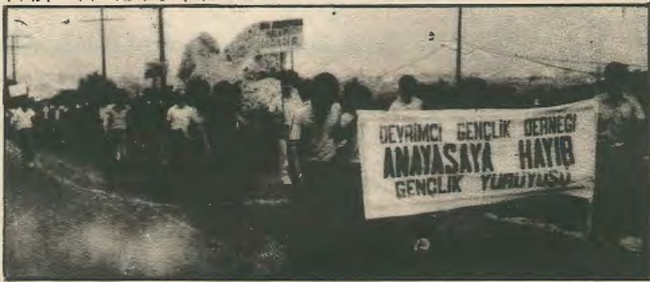
Απο την πορεία διαμαρτυρίας ενάντια στο σύνταγμα που οργάνωσε η Επαναστατική Νεολαία στις 21 Απριλίου.