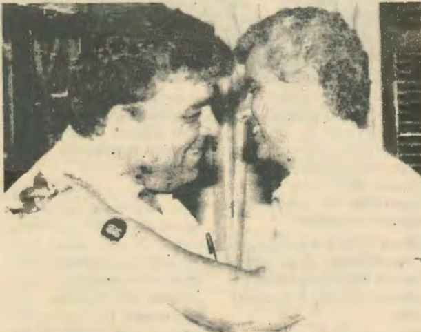
Ο Μποζκουρτ, ηγέτης του κόμματος Κοινωνικής Απελευθέρωσης μαζί με τον Ερογλου του Κόμματος Εθνικής Ενότητας.

εξουσία. Κατα κανόνα αυτο συνβέβαινε πάντα σε περιόδους οικονομικής κρίσης και γενικής αποσύνθεσης της αστικής κοινωνίας για να συγκρατηθούν οι εργάτες και να χτυπηθούν αργότερα με αποτέλεσμα η αριστερα να θεωρείται συνυπεύθυνη για όσα προκαλούσε η κρίση του αρρωστημένου