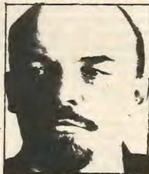
Λένιν: Τον Απρίλη του 17 επανεξόπλισε το κόμμα των Μπολσεβίκων με την επαναστατική πολιτική που οδήγησε στην επικράτηση της Σοσιαλιστικής Επανάστασης.

υπόλοιπες εθνότητες που έφταναν μέχρι τα 90 εκατομύρια. Σ' αυτές τις εθνότητες συμπεριλαμβάνονταν οι Ουκρανοί, Φιλανδοί, Γεωργιανοί κλπ. Καχυποψία, αντιπάθεια, μίσος χώριζαν τις διάφορες εθνότητες με τους Μεγαλορώσους. Χωρίς λοιπόν τη σωστή πολιτική, η επανάσταση εναντίον των καπιταλιστών, τον Οκτώβρη, είτε δεν θα ήταν δυνατή είτε θα διχοθετούσαν σε εθνικιστικά κανάλια με αποτέλεσμα αιματηρές εθνικές συγκρούσεις.