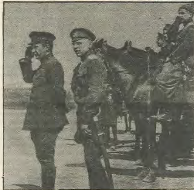
Ο πρωθυπουργός της προσωρινής κυβέρνησης Κερένσκυ επιθεωρεί τα στρατεύματα-του. Μέχρι τον Οχτώβρη δεν εύρισκε στρατεύματα να τον υποστηρίξουν στην πρωτεύουσα και τη γύρω περιοχή.

Στην Τσαρική Ρωσία τα εθνικά προβλήματα ήταν οξυτάτα. Οι Μεγαλορώσοι, η καταπιέζουσα δηλαδή εθνότητα, αριθμούσαν 70 εκατομύρια σε αντίθεση με τις