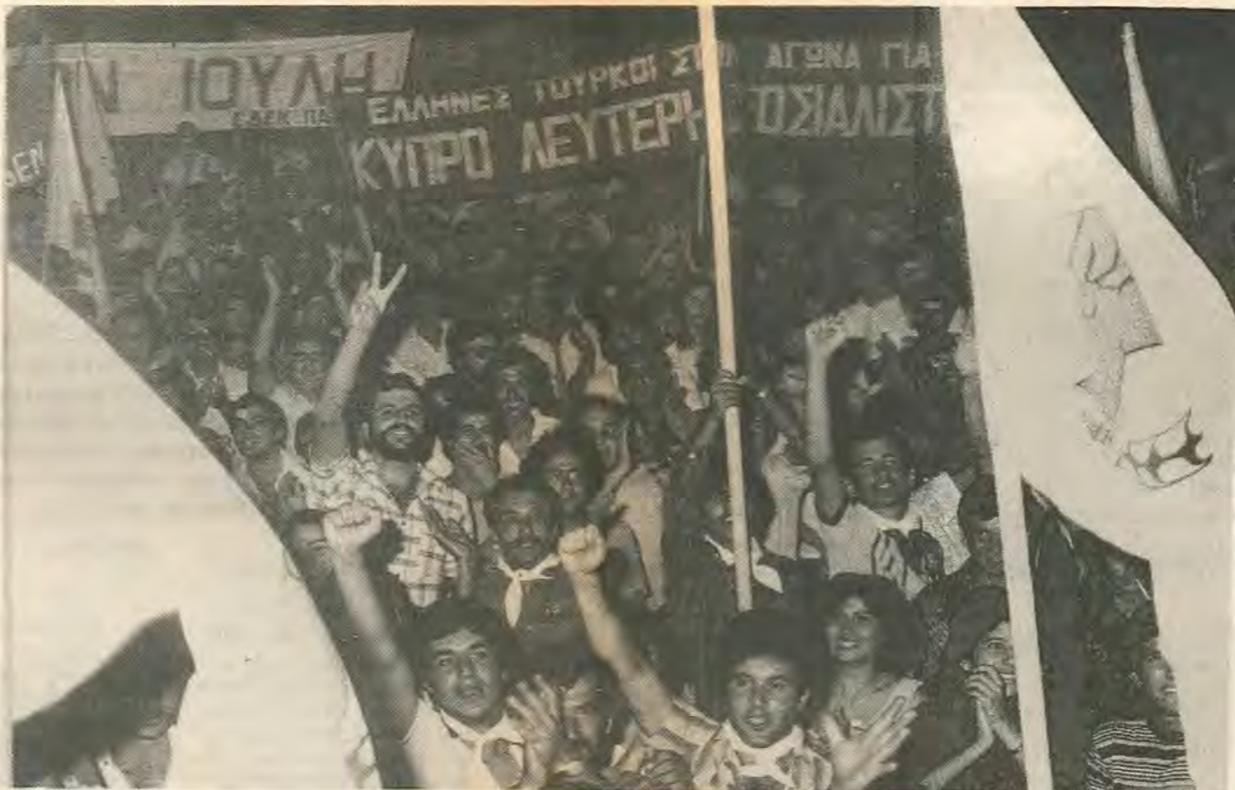
Εμπρος για μια δυνατή Σοσιαλιστική ΕΔΕΚ στην πρωτοπορεία του εργατικού κινήματος.

Συχνά ένας καπιταλιστής μπορεί πραγματικά να οδηγηθεί στην χρεωκοπία μέσα από το συναγωνισμό ανάμεσα σ' αυτόν και στους συναδέλφους του. Και πάλι οι εργάτες δεν έχουν καμμία ευθύνη για να πληρώνουν τα σπασμένα: γιατί ενώ ο κεφαλαιοκράτης θα ζει με τα λεφτά που για χρόνια είναι μαζεμένα από τη ράχη των εργατών ή θα επενδύσει σε νέους τομείς, ή οι εργάτες θα βρεθούν στο δρόμο. Τρανα παραδείγματα η χρεωκοπία των Ε.Χ.Β. -