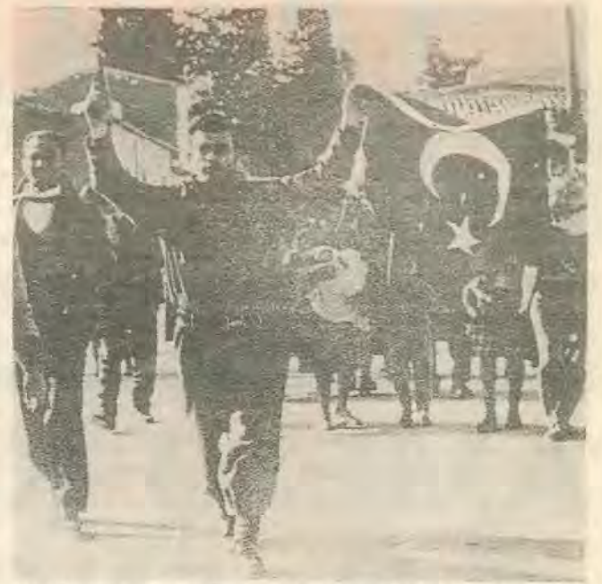
Ο «Τουρκοφάγος» Σαμψών πανηγυρίζει τη νίκη του μετά από την επίθεση και τις σφαγές αμάχων στην Ομορφίτα.

Και όμως τα ερωτήματα της ιστορίας προβάλλουν αμείλιχα. Κάθε συνειδητός νεολαίος μαχητής του σοσιαλισμού -κομμουνισμού πρέπει να απαντήσει σταράτα. Όταν η Ε.Φ. σκότωνε, βίαζε και λεηλατούσε τουρκοκυπριακούς πληθυσμούς, όταν ξεσπίτωνε 60.000 τουρκοκυπρίους και τους εξανάγκαζε με την βία και την τρομοκρατία να αναζητήσουν καταφύγιο στον Τ/Κ τμήμα της Λευκωσίας και στην λωρίδα γης προς την Κερύνεια όπου βρισκόταν η