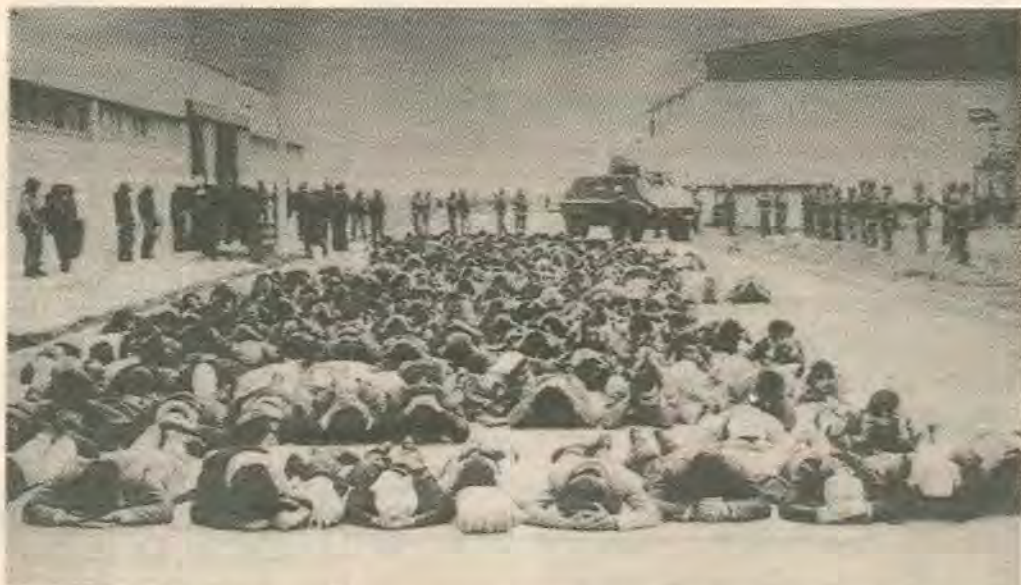
Πρωτομαγιά του 84 στην Κωνσταντινούπολη. Μόνο με χούντες και πραξικοπήματα μπορεί το κεφάλαιο να καθυστερήσει την σοσιαλιστική επανάσταση στη Τουρκία.

Φωνάζουν οι Έλληνες αστοί: η Κύπρος δίνει σήμερα τον «καλο αγώνα» του Ελληνισμού, συνεχίζει την τελεφταία μάχη των «Παλαιολόγων», να την βοηθήσουμε. Και όμως. Την εποχή του ιμπεριαλισμού δεν μπορούμε να μιλούμε για βοήθεια και συμπαράσταση. Ακόμα και αν υπάρχουν αυτά είναι απλά, ο τρόπος με τον οποίο εμφανίζεται η ΔΙΕΚΔΙΚΗΣΗ ενός ζωτικού χώρου. Λοιπόν όταν ο ελληνικός εμπορικός στόλος με χωρητικότητα 39.5 εκατ. κόρους απασχολεί πάνω από 100.000 Έλληνες ναφτεργάτες και αποτελεί το 15% του παγκόσμιου στόλου, τότε πρέπει να δούμε τα πράγματα και λίγο αλλιώς. Όταν αυτός ο στόλος δεν ασχολείται μόνο με το ελληνικό εξωτερικό εμπόριο αλλά κυρίως με τις μεταφορές μεγάλων μονοπωλιακών συγκροτημάτων της παγκόσμιας αστικής αγοράς, όταν το 1/3 αυτού του στόλου είναι πετρελαϊκά οφόρα που ασχολούνται με την μεταφορά πετρελαίου της Εγγυς Ανατολής, όταν οι ιδιοκτήτες αυτών των πετρελαϊκών οφόντων είναι την ίδια στιγμή οι μεγαλύτεροι εφοπλιστικοί οίκοι της Ελλάδας, όταν το ναφτιλιακό κεφάλαιο ελέγχει ισχυρές θέσεις μέσα στη βιομηχανία και τις τράπεζες, όταν οι Έλληνες εφοπλιστές είναι μέλη και συναιτέροι του παγκόσμιου κοσμοπολιτικού