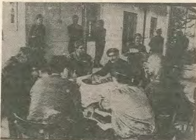
Ο Γρίβας και οι αξιωματικοί που πίνουν τον καφέ τους στο σταθμό Σκαρίνου μετά τις σφαγές της Κοφίνου.

«Το πρώτο που θέλουμε να υπογραμμίσουμε είναι το ότι η