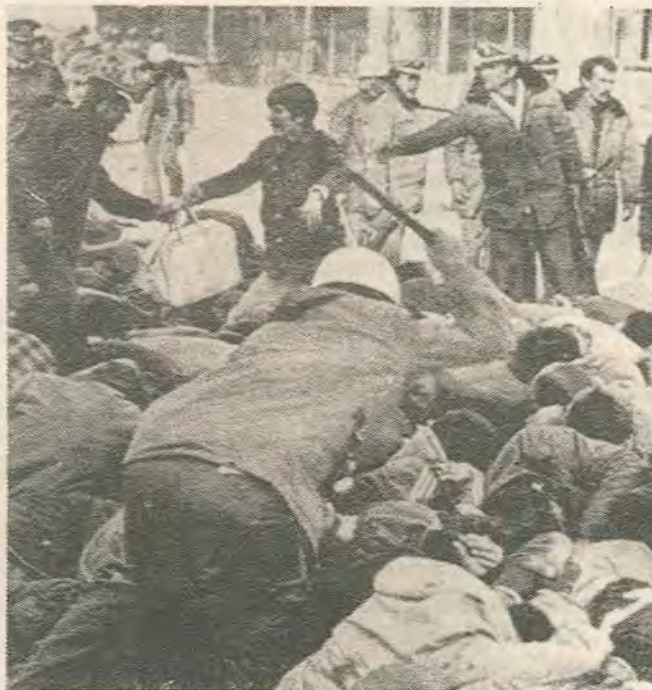
Με αυτό τον τρόπο η χούντα του Εβρεν κρατιέται στην εξουσία

Με δεδομένη την υποστήριξη των στρατηγών προς το κόμμα του Οζαλ, τα αποτελέσματα δείχνουν τη δυσαρέσκεια της συντριπτικής πλειοψηφίας του Τούρκικου λαού προς το