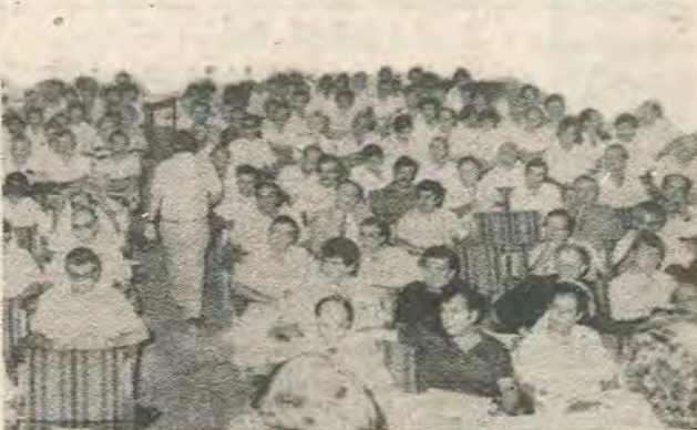
Απο τη σύσκεψη στελεχών όλων των επαγγελματικών κλάδων και επαρχιακών τμημάτων της ΠΑΣΥΔΥ

Η ΠΑΣΥΔΥ προγραμματίζει δυναμικά μέτρα σ' αντίδραση στην καθυστέρηση της Κυβέρνησης να επιλύσει τα προβλήματα που απασχολούν την Δ. Υπηρεσία.