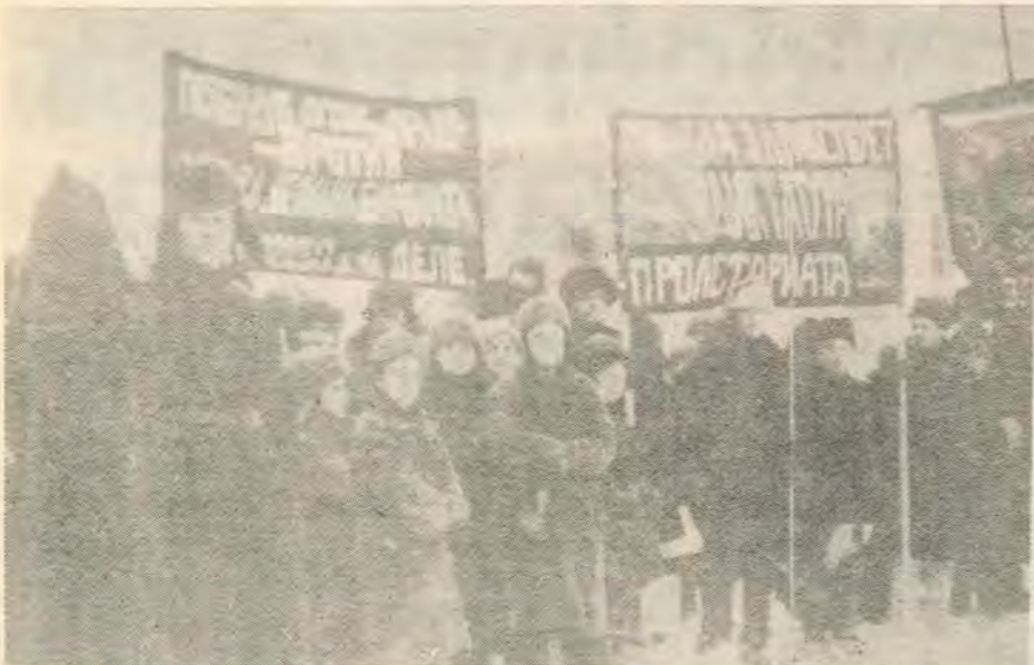
1928 - Η Αριστερή Αντιπολίτευση γιορτάζει την επέτειο της Οκτωβριανής Επανάστασης

Ο Οκτώβρης άνοιξε τις πόρτες κι οι μάζες ξεχύθηκαν με τη δράση τους για την κατάκτηση του σοσιαλισμού. Οι καταπιεσμένοι απ' τον καπιταλισμό λεφτερώθηκαν και κατανοώντας τη δύναμη-τους άρχισαν ν' αναπτύσσουν την ανθρώπινη-τους προσωπικότητα. Σήμερα όμως τα παραμορφωμένα εργατικά κράτη τίποτα δεν θυμίζουν απ' τον Οχτώβρη. Ο Οχτώβρης αντικαταστάθηκε απ' τη γραφειοκρατία και τα στελέχη της που αναλαμβάνουν να υλοποιήσουν από τα πάνω και εργολαβικά κάποιες ντριεχτίες β. «σοσιαλισμού σε μια χώρα» ενεργώντας στ' όνομα της εργατικής τάξης και της ζωντανής ελεύθερα οργανωμένης δράσης της. Η γραφειοκρατία χωρίς νάχει εμπιστοσύνη στις εργατικές μάζες υποκαθιστά τη δράση τους.