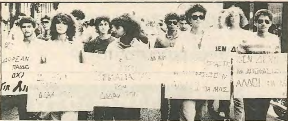
Πικετοφορία των φοιτητών του Α.Τ.Ι. ενάντια στις αυξήσεις των διδάκτρων

πισώπλατη μαχαίρια στις μάζες, ένα ακόμα δυσβάστακτο βάρος για τις οικογένειες των φοιτητών.