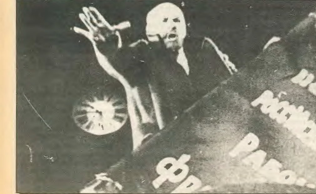
Ο Λένιν μιλά σε δημόσια συγκέντρωση εργατών. Η νικηφόρα επανάσταση που καθοδήγησε ο μπολσεβίκος ηγέτης ήταν η εναρκτήρια στιγμή της παγκόσμιας σοσιαλιστικής επανάστασης.

αφο οι μεταρρυθμιστές φωνάζουν: εκσυγχρονισμός - εκδημοκρατισμός. Νιώθοντας την ανάσα της πολιτικής επανάστασης κήρυξαν την «επιστροφή στο Λένιν». Η νομιμοποίηση όμως της ιδιωτικής εργασίας στο εμπόριο και την βιοτεχνία και οι μίχτες επιχειρήσεις με τα Δυτικά μονοπώλια, η πληρωμή της δουλειάς με το κομμάτι και τα πριμ δεν είναι επιστροφή στο Λένιν αλλα επιστροφή σ' αφο που ο Λένιν χαρακτήρισε «υποχώρηση στον καπιταλισμό». Είναι επιστροφή στη Νέα Οικονομική Πολιτική που εγκαινιάστηκε στα 1920-21 μετα την