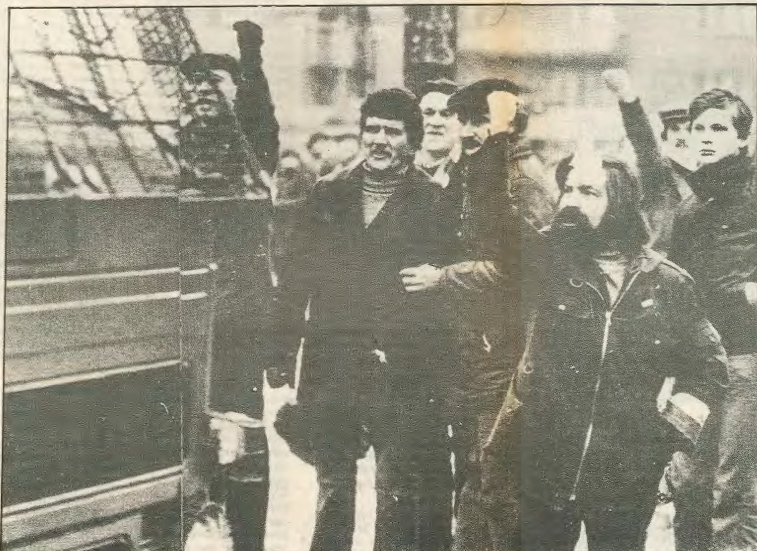
Οι ασκοί του Αϊόλου άνοιξαν. Η κοινωνία δεν ανέχεται άλλο τη γραφειοκρατία.

στη γραφειοκρατία φτάνει στο τέλος της. Τότε στα χρόνια του μεσοπολέμου το καθήκον της ανάπτυξης της βαρίας βιομηχανίας σε συνθήκες πρωτόγονης οικονομίας, για μια σχεδιασμένη κοινωνία ήταν ένα σχετικά έφκολο καθήκον. Σήμερα όμως αφτη η μοντέρνα πολύπλοκη οικονομία δεν μπορεί