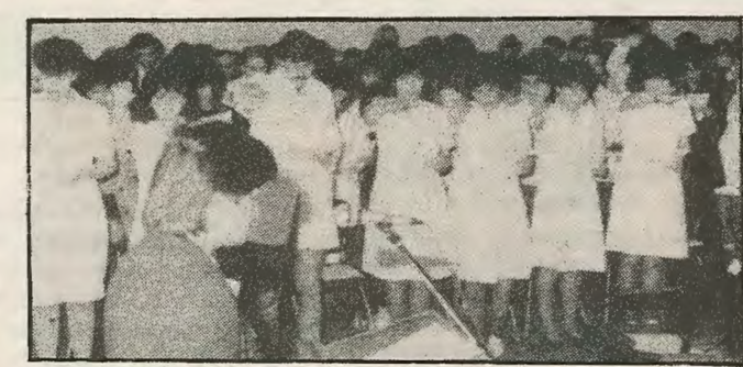
Ένα οι νοσοκόμοι απεργούν για επάνδρωση θέσεων.

Πρόσφατα είδαμε την απεργία στο Μακάριο νοσοκομείο λόγω της πληθώρας των ασθενών που εισήχθηκαν και την ελλειψή επαρκούς νοσηλευτικού προσωπικού για την κάλυψη των αναγκών. Η κυβέρνηση όμως, αντι να κτυπήσει στη ρίζα του του κακού, με το να προσλάβει μόνιμο προσωπικό για την κάλυψη των αναγκών του νοσοκομείου, δίνει εντολές οι ασθενείς να εξεργάζονται πιο χωρίς από την καθορισμένη μέρα, με αποτέλεσμα την μη κανονική περίθαλψη τους. Η καιροσκοπική αντιμετώπιση του προβλήματος από μερικούς της κυβέρνησης, με την πρόσληψη 15