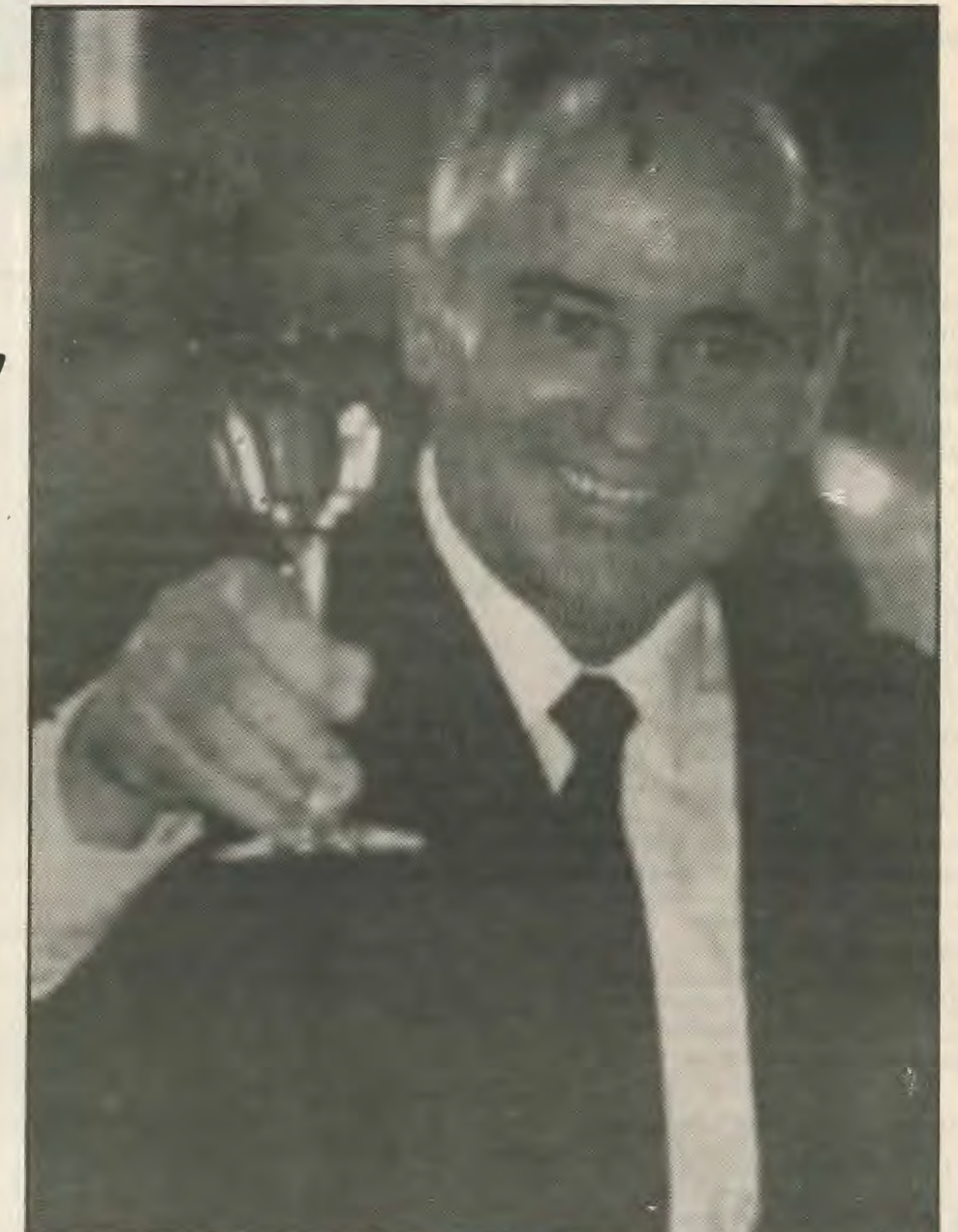
Το καινούργιο πορτραίτο της σοβιετικής γραφειοκρατίας δεν έχει καμμία σχέση με τον απλοϊκό και επαναστατικό τρόπο ζωής των Μπολσεβίκων ηγετων του 17.

Οι γραφειοκράτες όμως μετράνε την αρχή «αφο τον καθένα σύμφωνα με τις ικανότητες στον καθένα σύμφωνα με την εργασία του» σε συνταγματική βάση της κοινωνίας. Αφτη είναι η ρίζα των προνομίων της γραφειοκρατίας και ο Γκορπατσώφ δεν θέλει να την κόψει. Ο νόμος της αξίας