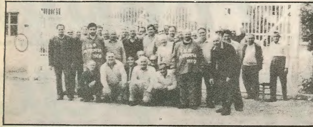
Απεργιοι στο αγρόκτημα Φασουρίου.

Είμαι οι εργάτες αυτοί που έβλεπαν μπροστά τους