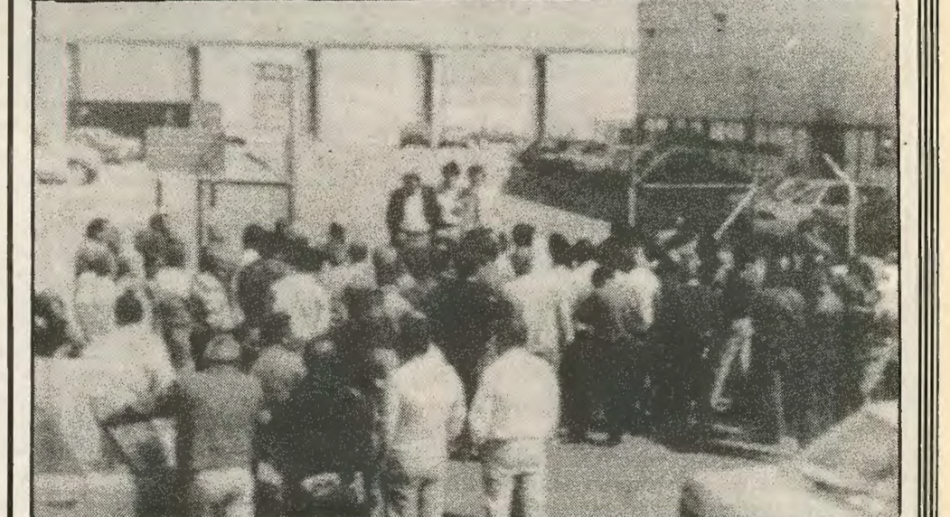
Από την πρόσφατη 2ωρη στάση εργασίας των λιμενεργατών. Μόνο η πάλη για μειωμένο ωράριο εργασίας μπορεί να λύσει το πρόβλημα και όχι οι απολύσεις.

και όποτε έχουν δουλειά να παίρνουν έκτακτα από την Β' λίστα. Θα πληρώνουν πολύ περισσότερα αν γίνει ενιαία λίστα και θα αναγκαστούν να πληρώνουν τακτικά γύρω στους 200-250 λιμενεργάτες (αριθμός απαραίτητος για την ομαλή λειτουργία του λιμανιού). Ο μόνος τρόπος για να λυθεί το πρόβλημα της ανεργίας είναι με την μείωση των ωρών εργασίας χω-