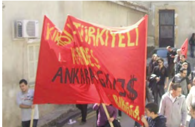
Pankart: Kıbrıslı Türkiyeli kardeş, Ankara Kalles...

Kıbrıs'ın tarihinde ilk kez bu kadar büyük bir