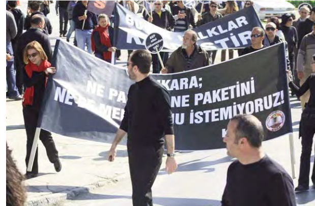
Pankart: Ankara; Ne paranı, ne paketini, ne de mumurunu istemiyoruz!

boyutta Kıbrıslı-Türkiyeli tartışması yaşandı. Birçok bakan, AK Parti yetkilisinin yanında televizyon ve gazetelerden de söz deloları devam etti ortam daha da gerildi. İkinci randevuya; yani 2 Mart'a gelinirken bütün taşlar yerinden oynatıldı. "Varoluş Mitingi", Türkiye'den özürlü mitingine dönüştürüldü.