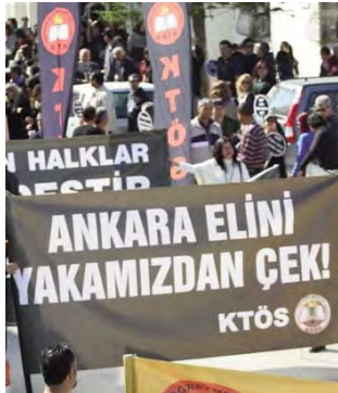
Pankart: Ankara elini yakamızdan çek!

Tüm dünyada sınırsız özgürlüklerle dolaşan sermaye, yaşadığı ekonomik krizi yumuşatma adına örgütlü bulunduğu kuruluşlar aracılığıyla dünya halklarının kazanılmış haklarına karşı çok ciddi bir savaşa girişmiştir. Soğuk savaş mı sıcak savaş mı, ne demek gerek bilmiyorum; ama bir savaş olduğu açıktır. Emekle sermaye arası bir savaş.