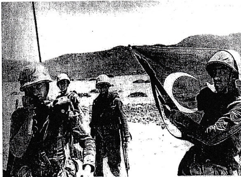
20 Ιουλίου 1974, Κυρήνεια. "Επιτέλους, πού είναι οι Έλληνες;" αναρωτιούνται οι Τούρκοι φαντάροι πριν αναχωρήσουν για τη Μερσίνα προκειμένου να παραλάβουν το δεύτερο αποβατικό σώμα. Εν τω μεταξύ, φωτογραφίζονται με την τουρκική σημαία.

22/11/2002), με την πρόσθεση νέων συμμάχων (Εσθονία, Λιθουανία, Λετονία, Σλοβενία, Σλοβακία, Ρουμανία, Βουλγαρία). Επιβεβαιώνονται για ακόμη μια φορά οι αρχικές δηλώσεις του διαβόητου δολοφόνου Μπους και της κλίμακας του ("όποιος δεν είναι μαζί μας, είναι εχθρός μας"), αλλά και οι προθέσεις των απαιτακού εξουσιαστών να εξασφαλίζουν τη συμμετοχή ολοένα και περισσότερων κρατών στις στρατιωτικές επιδρομές παγκόσμιας εμβέλειας, διατηρώντας σημείο επαφής μεταξύ ΗΠΑ - Ευρώπης - Ρωσίας, όπου θα συζητάσσονται η βιομηχανία όπλων και οι νέες τεχνολογίες.