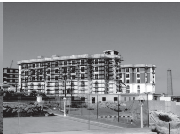
Αποθήκες πετρελαίου Ζεγκο στην Κερύνεια: Στη θέση τους βρίσκεται πλέον το ξενοδοχείο Kaya Plaza Hotel, η ανέγερση του οποίου υπήρξε η αφορμή για τη δημιουργία της «Πρωτοβουλίας Κερύνειας»). Το μόνο που θυμίζει τις αποθήκες Ζεγκο είναι η καμινάδα στα δεξιά της φωτογραφίας.