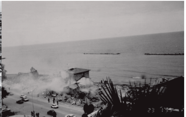
Αποθήκες Θεοδοσίου στη Λεμεσό: Η κατεδάφιση τους το 1995 αποτελεί κομβικό σημείο όσον αφορά αφενός τις αντιστάσεις πολιτών ενάντια στην καταστροφή πολιτιστικής κληρονομιάς της πόλης, και αφετέρου τη ραγδαία αλλαγή του παραλιακού μετώπου της πόλης.