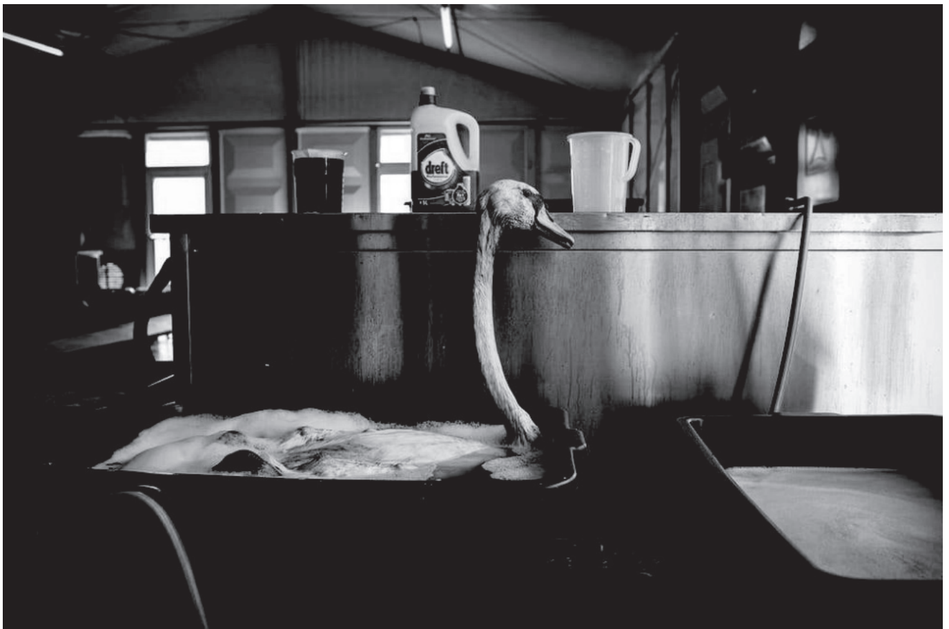
Workers clean oil off a swan at a bird shelter in the Netherlands after a tanker crashed into a jetty in the port of Rotterdam spilling about 200 tonnes of oil into the water and affecting hundreds of the birds.

* Χρύσα, ε, ζύπνα. Δεν είναι ώρα για άλλους νεκρούς πουλάκι μου. Ακόμα δε μου είπες «Ποιος ανακάλυψε την* Όχι. Δε θα επιστρέψω. Αμερική»;