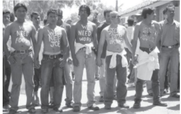
Απο παλιότερη κινητοποίηση μεταναστών

Το πρόβλημα όμως παραμένει. Η Μενόγεια πρέπει να κλείσει. Οι μετανάστες που ήρθαν στη Κύπρο για να γλυτώσουν από πολέμους, αυταρχικά καθεστώτα ή απλά από την πείνα και τη φτώχεια δεν είναι εγκληματίες. Αντίθετα οι περισσότεροι από αυτούς προσφέρουν στην οικονομία και τη κοινωνία και καλύπτουν ανάγκες στην παραγωγή που κανείς δεν θέλει να καλύψει. Πρέπει να σταματήσει αυτή η ρατσιστική αντιμετώπιση τους από το κράτος που τους