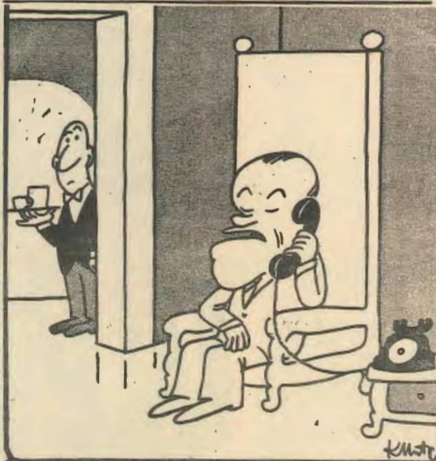
Παρόργγυλλα κοφεδάκι. Έγκρίνεται; (του Κώστα Μητρόπουλου)

Στην Χιλή υπάρχει το φασιστικόν κίνημα «Πατρίς και