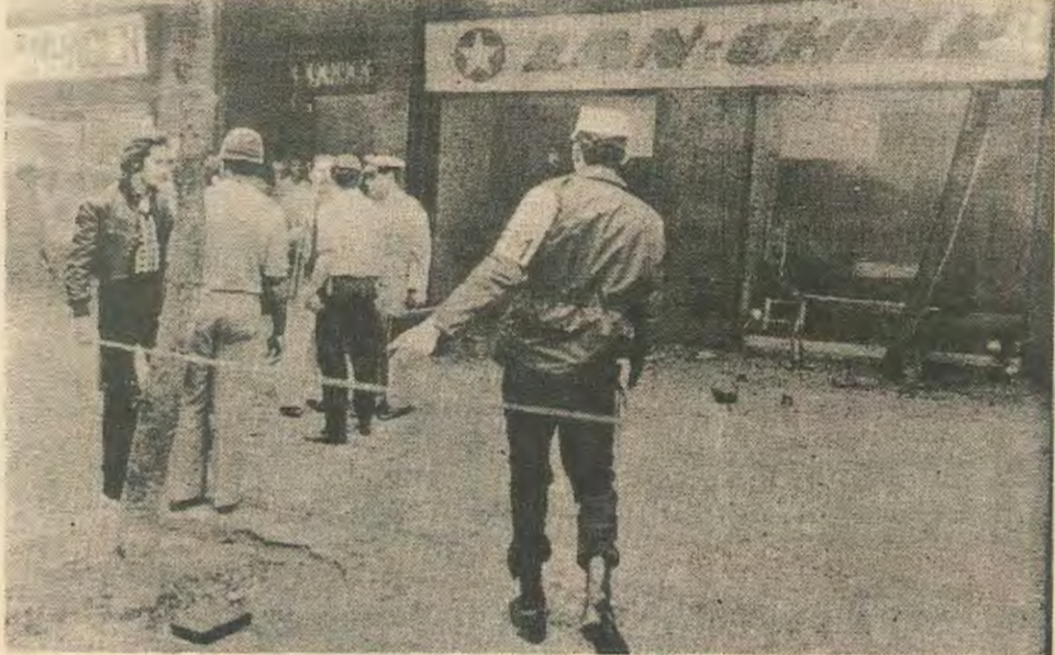
Η αντίδραση κατά της χιλιανής κυβέρνησης Εσοπά, τώρα, σε άλλες χώρες. Όπως, στην συγκεκριμένη περίπτωση στο Ρίο Γανέιρο, την Βραζιλία όπου ισχυρή ομάδα κατόπιν του γραφείου της Πολιτικής Αεροπορίας της Χιλής. Στην φωτογραφία Βραζιλιανοί άστυνομικοί φρουρούν το κτίριο της εταιρίας.

καταδέχτηκαν να κατεβούν στο πεζοδρόμιο και να κτυπήσουν άδειες κατασάρκες πλάι - πλάι με τις ύπηρετρίες τους.