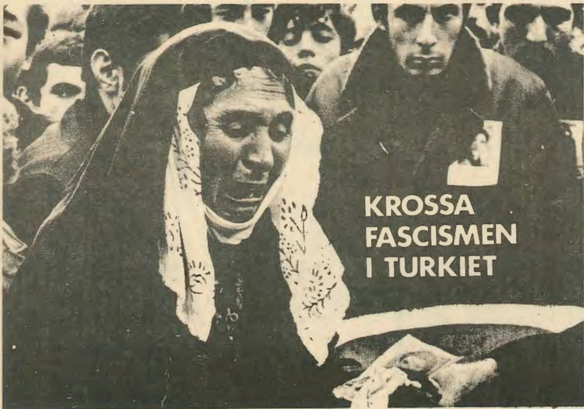
ΚΑΤΩ Ο ΦΑΣΙΣΜΟΣ ΣΤΗΝ ΤΟΥΡΚΙΑ

Στο μεταξύ άρχισε και ο αντιαμερικανισμός στην Τουρκία με διαδηλώσεις και άλλες εκδηλώσεις. Και έτσι, από την μία το Κομμουνιστικό και το Έργατικό Κόμμα δεν είχαν δύναμη και δεν μπορούσαν να οδηγήσουν το κίνημα και από την άλλη έμεις ή Νεολαία δεν το σκεφτόμαστε α-