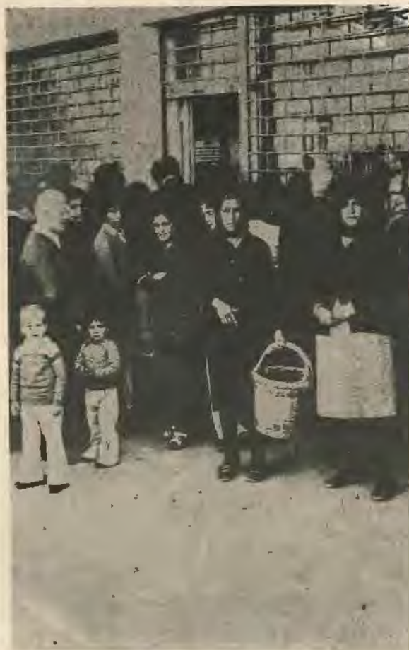
γ) Παροχή χαμηλότοκων δανείων στους αγρότες.

δ) Κρατικοποίηση της εκκλησιαστικής και άλλης ανεκμετάλλευτης γης και παράδωσή της σε αγρότες πρόσφυγες.