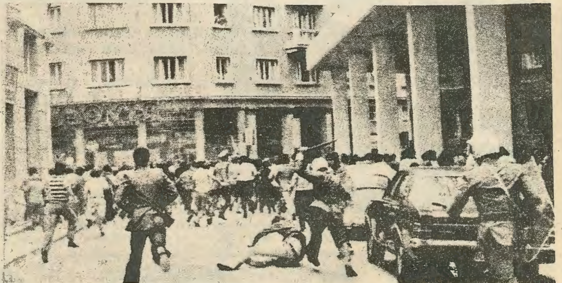
Γαχώσεις της έθνοκοινοβουλευτικής άριστερας.

Με τό πρόσχημα των έξωτερικών κινδύνων χτίζεται ξανά η περιδότηη «Εθνική