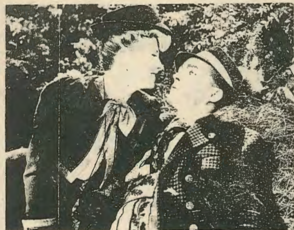
Τζόαν Φονταίν — Μπίγκ Κρόσμπυ.

Πρωταγωνιστούν: Μπίγκ Κρόσμπυ, Τζόαν Φονταίν, Ρόλαντ Κάλβερ, Λούσιλ Ουάτσον και Ρίτσαρντ Χάυντν. Σκηνοθεσία: Μπίλλυ Ουάιλτερ.