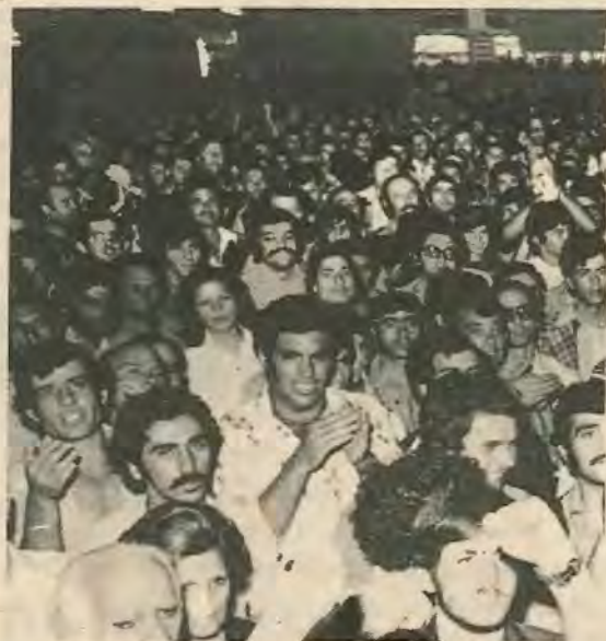
Από τις προεκλογικές συγκεντρώσεις του «Δημοκρατικού Κόμματος» και του «Δημοκρατικού Συναγερμού» στη Λευκωσία.

ποτελούσαν βασικό τέντ στον αγώνα του για πλήρη κατάληψη της εξουσίας. Έτσι το 36% του Συναγερμού είναι αρκετά διογκωμένο.