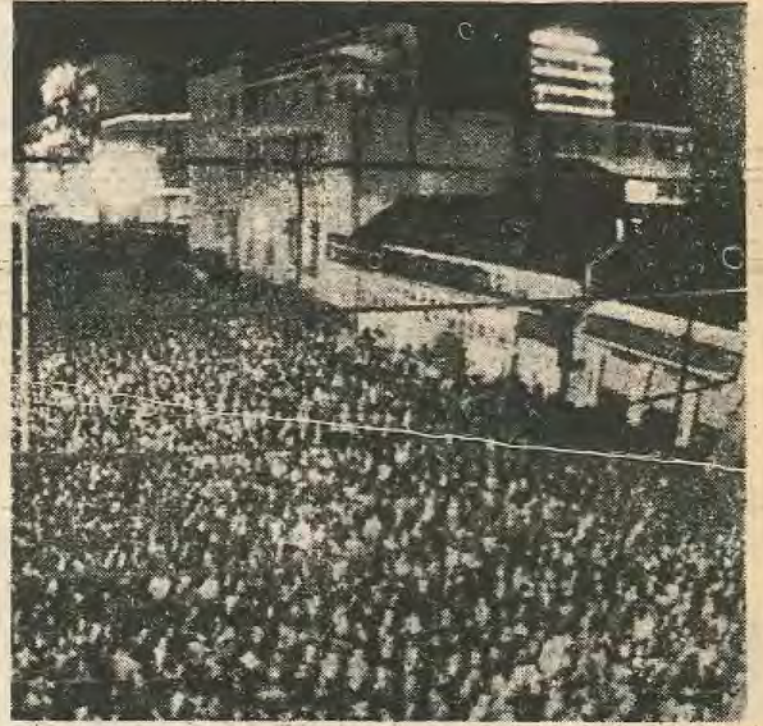
Από την προεκλογική συγκέντρωση του ΠΑΣΟΚ στη Λάρισα.

Από την άλλη, είναι αμφίβολο αν η ΕΔΗΚ του κ. Μαύρου είναι διατεθειμένη να συνεργαστεί με τις αριστερές