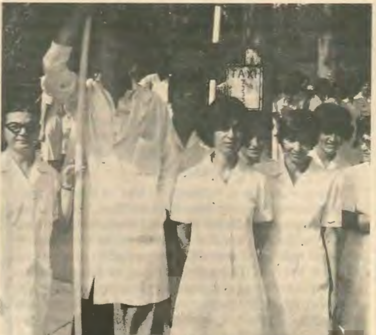
Οι και των παρανόμων επεμβάσεων της στη Δ.Υ.

Όπως υποστηρίξαμε και στο προηγούμενο μας άρθρο για τους δημόσιους υπαλλήλους επιβάλλεται όπως αποφασιστικά προχωρήσουν στην απαίτηση των δικαιωμάτων τους χωρίς ταλαντεύσεις και υποχωρήσεις στις οποίες θα σπρώξει η κυβέρνηση όπως και στο παρελθόν