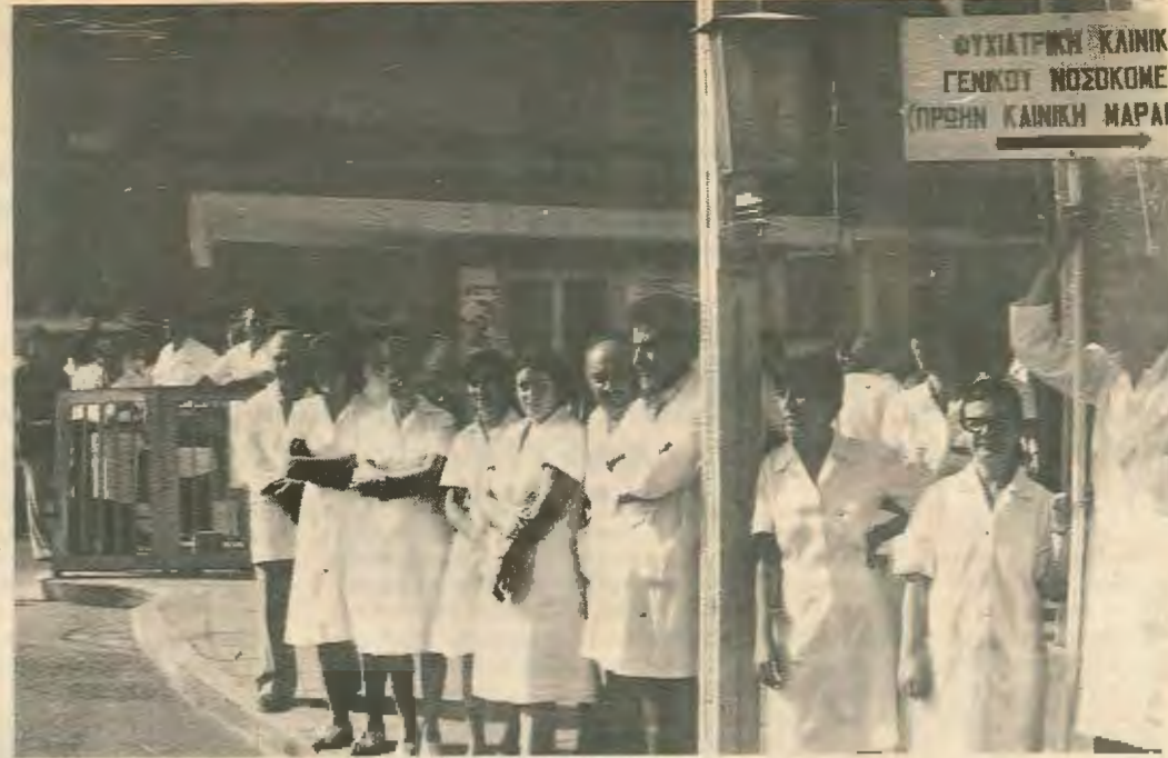
Το νοσηλευτικό προσωπικό των νοσοκομείων παγκύπρια, κατέβηκε σε δίωρη στάση εργασίας με απαίτηση την ικανοποίηση των κλαδικών αιτημάτων για αποζημίωση για εργασία κατά τα σαββατοκυριακά και αργίες καθώς επίδομα βάρδιας για νυχτερινή εργασία. Η στάση εργασίας ήταν καθολική και πολλοί νοσοκόμοι που βρίσκονταν εκτός καθήκοντος εκείνη την ώρα παρουσιάστηκαν για να συμμετάσχουν στην απεργία.

Νοσοκόμοι και νοσοκόμες με τους οποίους μιλήσαμε φαίνονται αποφασισμένοι να κατέλθουν σύντομα σε δυναμικότερο αγώνα αν η Κυβέρνηση δεν τους ικανοποιήσει τις προσεχείς μέρες. Καμμία άλλη πίστωση χρόνου δεν θα δώσουν αφού η τελευταία προειδοποίηση και προθεσμία 20 ημερών που έδωσαν προς την κυβέρνηση, έληξε τη μέρα της στάσης-τους.