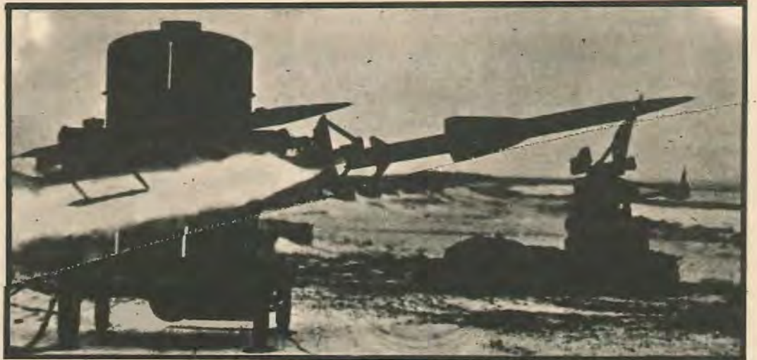
ΟΙ ΝΕΟΙ ΤΥΠΟΙ άντιαεροπορικών πυραύλων "Rapier", Άγγλικής κατασκευής, με τους οποίους οι Βρεττανοί ενισχύουν αυτό τον καιρό με άκρα μυστικότητα την αντιαεροπορική άμυνα της βάσεως Ακρωτηρίου. Τους μετέφερε στην Κύπρο τό Βρετανικό ελικοπτεροφόρο «Ερμής». Έχουν μήκος 2.2 μέτρων και μπορούν να πλήττουν στόχους μέχρι ύψους 3.000 μέτρων.

Να φύγουν οι βάσεις από την Κύπρο είναι το άμεσο αίτημα του λαού.