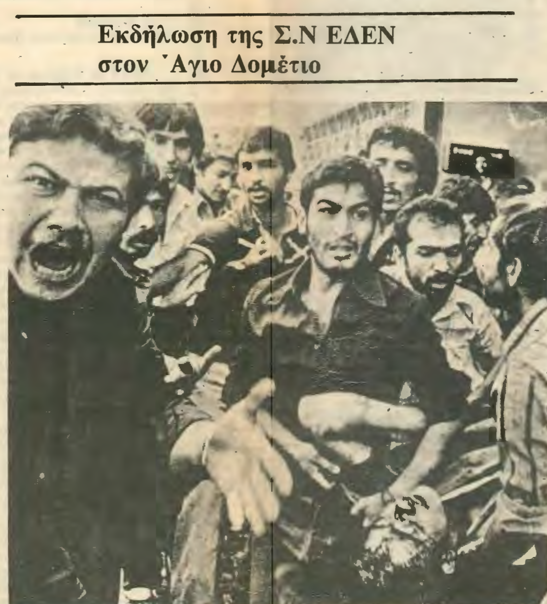
Εκδήλωση της Σ.Ν ΕΔΕΝ στον Άγιο Δομέτιο

Η εξέγερση στο Ιραν όπως και στη Ρωσία του 1905 άρχισε με τις απαιτήσεις για μεταρρυθμίσεις από τον μονάρχη. Και στις δύο περιπτώσεις ο στρατός