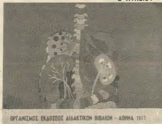
ΟΡΓΑΝΙΣΜΟΣ ΕΚΔΟΣΕΩΣ ΔΙΔΑΚΤΙΚΩΝ ΒΙΒΛΙΩΝ - ΑΘΗΝΑ 1977

● Φοβερές αρρώστιες του γεννητικού συστήματος απειλούν πάντα τον άνθρωπο. Σημειώνουμε δυο μονάχα: τη βλεννόρροια και τη σύφιλη. Αυτές μπορούν να οδηγήσουν τον άνθρωπο από την τύφλωση ως την τρέλα.