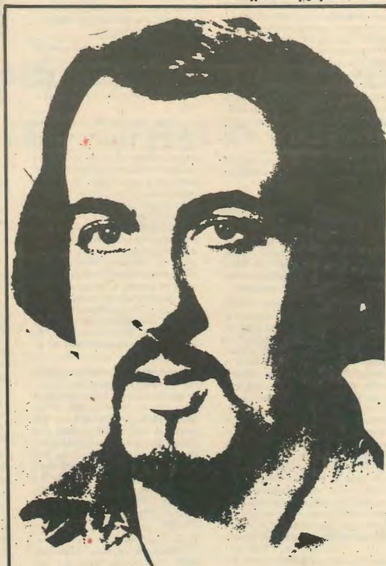
Ο ΔΩΡΟΣ ΖΕΙ ΚΑΙ ΜΑΣ ΚΑΘΟΔΗΓΕΙ