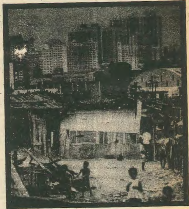
ΣΑΟ ΠΑΟΛΟ, ΒΡΑΖΙΛΙΑ

Για ολόκληρη τη Λατινικη Αμερικη της οποίας το χρέος ανέβηκε στα 240 δεσε-