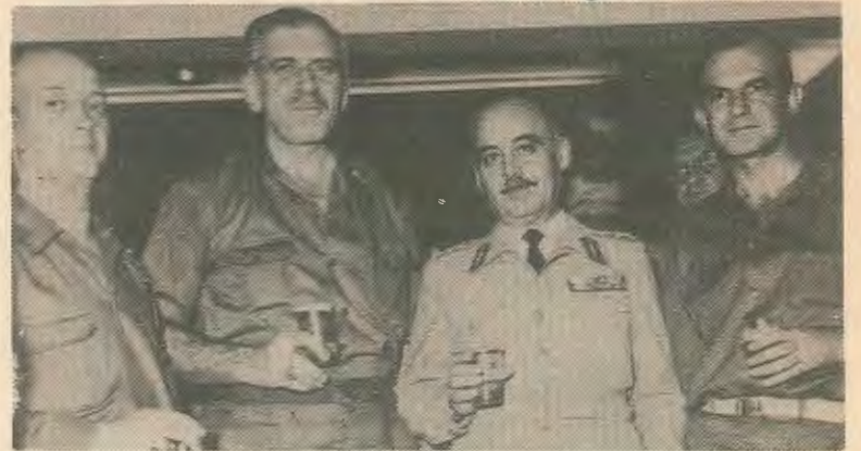
Οι κίνδυνοι για μια νέα 21η Απριλίου δεν έχουν εξαληφτεί.

Υ.Γ. Εκπρόσωπος της Αμερικανικής Κυβέρνησης δήλωσε πως οι ΗΠΑ είναι εναντίον αντικυβερνητικού κινήματος στην Ελλάδα. Ξέχασε να προσθέσει «για την ώρα».