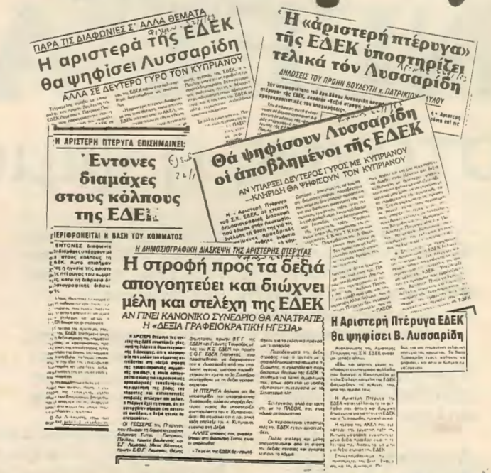
Τη δημοσιογραφική διάσκεψη που δόθηκε στις 21.1.83 κάλυψε στο σύνολο του ο καθημερινός τύπος εκτός από τα «ΝΕΑ».

Τα συμπεράσματα μας από όλη τη προεκλογική καμπάνια