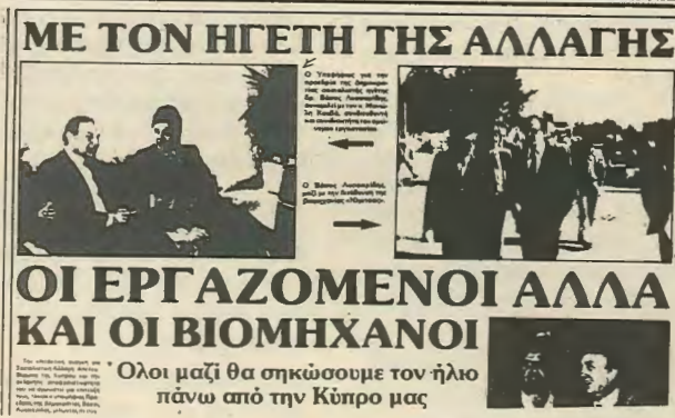
Αλλαγή με ποιους, αλλαγή για ποιους;