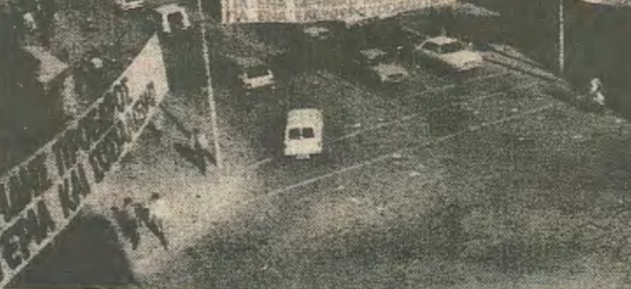
Η πιο έντονη και δαπανηρή προεκλογική εκστρατεία στην ιστορία της Κύπρου.

Οι απλοί Ακελικοί έβλεπαν με προβληματισμό και αμφισβήτηση την τακτική που η ηγεσία τους ακολούθησε δίνοντας για