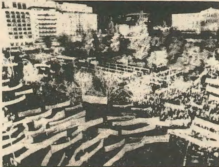
Απο το πρόσφατο συλλαλητήριο στην Αθήνα ενάντια στις Αμερικανικές βάσεις.

τις δυνάμεις ν' απαλλαχτεί από την παρουσία του Παπανδρέου στην Κυβέρνηση. Η δεξιά δεν είναι σε θέση να προσφέρει οτιδήποτε και η αποσύνθεση της Νέας Δημοκρατίας κάμνει απίθανη την εκλογική της επιτυχία στο τέλος της τετραετίας. Είναι φυσικό πολλοί να ονειρεύονται μια στρατιωτική ανατροπή, μια νέα εφταετία.