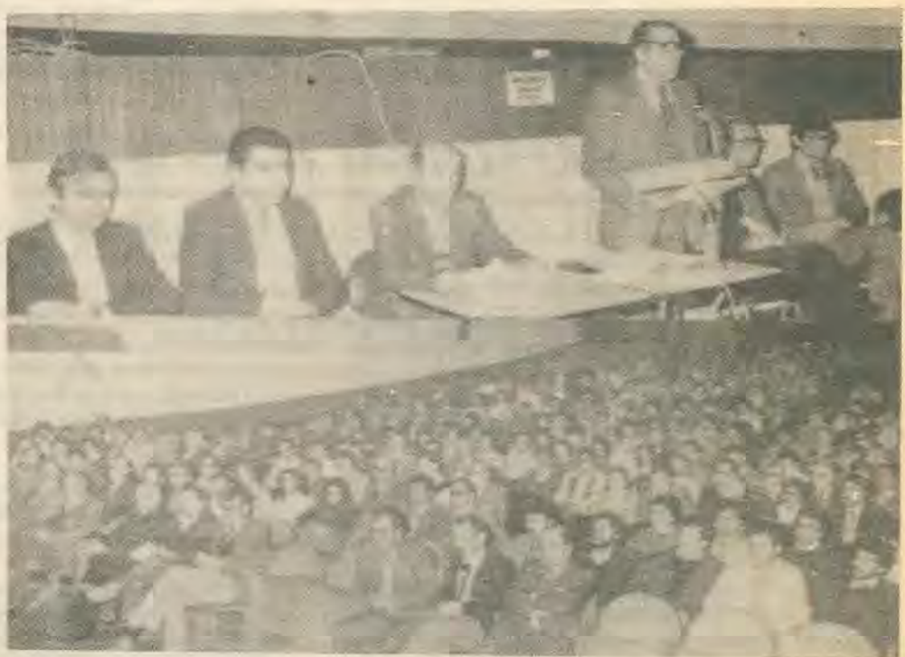
για τα δίκαια τους. Πριν είναι πολύ αργά, πριν αρχίσουν να δυακουδούνται και τα

Να βγουν από το καβούκι τους και να μπουν στον αγώνα