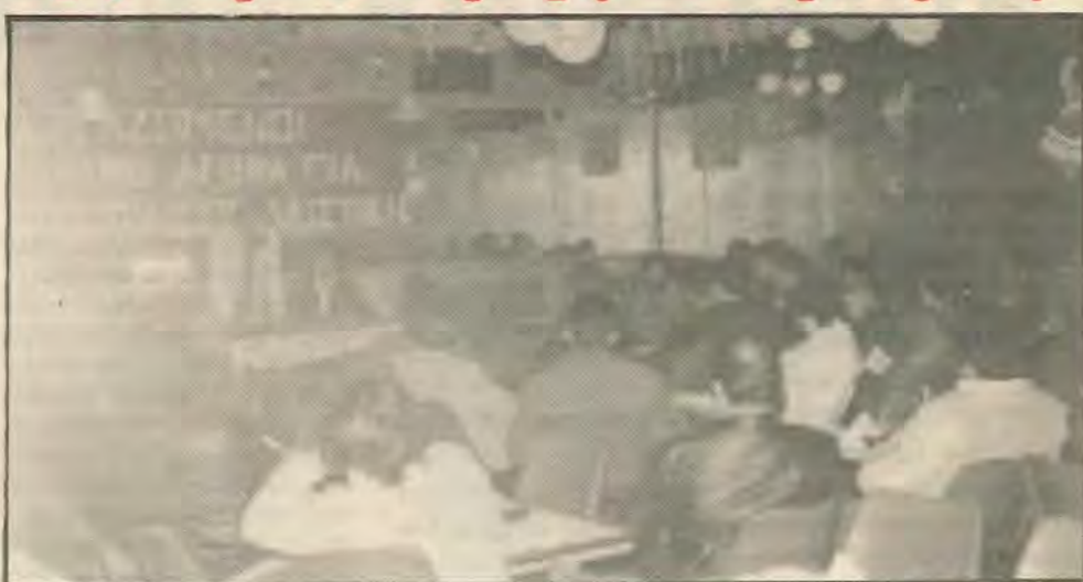
Μέρος των συγκεντρώσεων στην Αθηναίου και Λεμεσο.

Με την καμπάνια και τις ανοιχτές συγκεντρώσεις