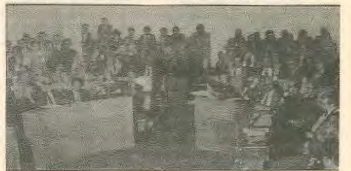
Απο τη ψηφοφορία για ανάδειξη προέδρου της βουλής.

Όμως η τάση αυτή για μαζικοποίηση θα πληρωθεί με αντίτιμο την ιδεολογική