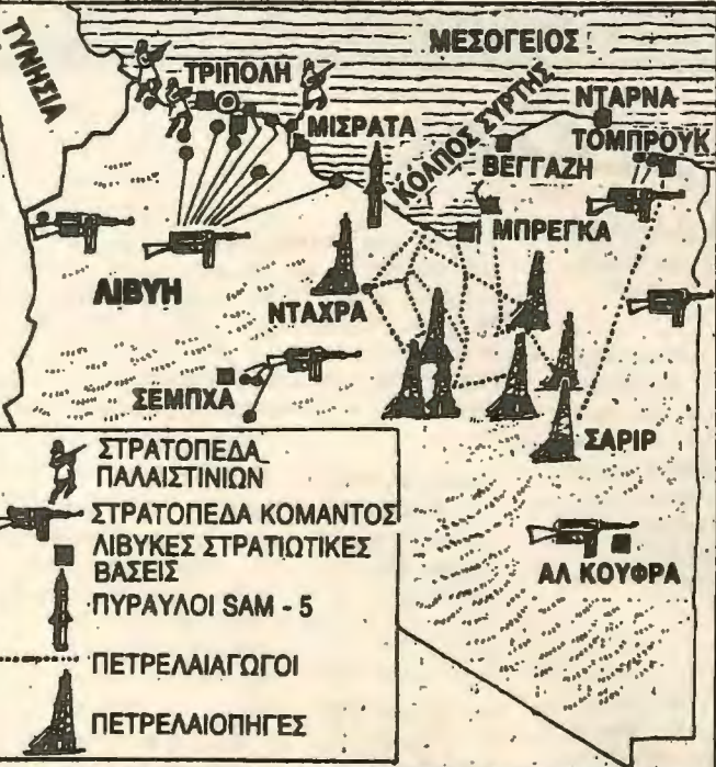
Χάρτης της Λιβύης με τις πετρελαιοπηγές και τους στρατιωτικούς στόχους

μορφωμένα με πιο έντονη στρατιωτική δράση τύπου Ρώμης και Βιέννης, αντι για αναπροσανατολισμό στις μεθόδους της μαζικής δουλειάς στις κατεχόμενες περιοχές, στην Ανατολική όχθη, και μέσα στο ίδιο το Ισραήλ. Κανένας Ισραηλινός εργάτης δεν μπορεί να υπο-