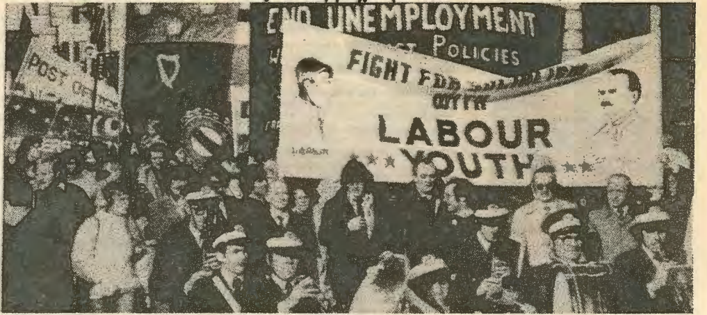
Διαδήλωση της Σοσιαλιστικής Νεολαίας ενάντια στην ανεργία.

λανδοί, θα αποδεικνύονταν ανήμποροι να σταματήσουν μια τέτοια εξέλιξη και τις βίαιες επιπτώσεις της. Οι Βρετταννοί διατηρούν 9,000 στρατο. Οι προτεστάντες έχουν 22,000 οπλι-