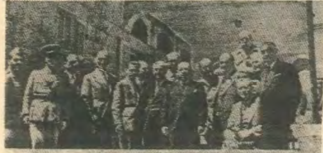
Η διάσκεψη του Λιδάνου: Διακρίνονται ο Γ. Παπανδρέου, ο Π. Ρούσος (μέλος του Π.Γ. του ΚΚΕ) και ο Μ. Πορφυρογένης, μέλος της ΠΕΕΑ