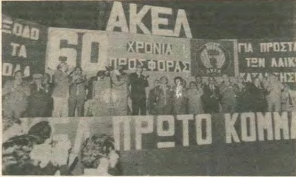
Απο προεκλογική συγκέντρωση του ΑΚΕΛ

από πιο νέους δεν λύει το πρόβλημα (μια τάση που άρχισε ήδη να αναπτύσσεται μέσα στο κόμμα) ούτε και η φραστική αγωνιστική τοποθέτηση της ηγεσίας σε επιμέρους ζητήματα.