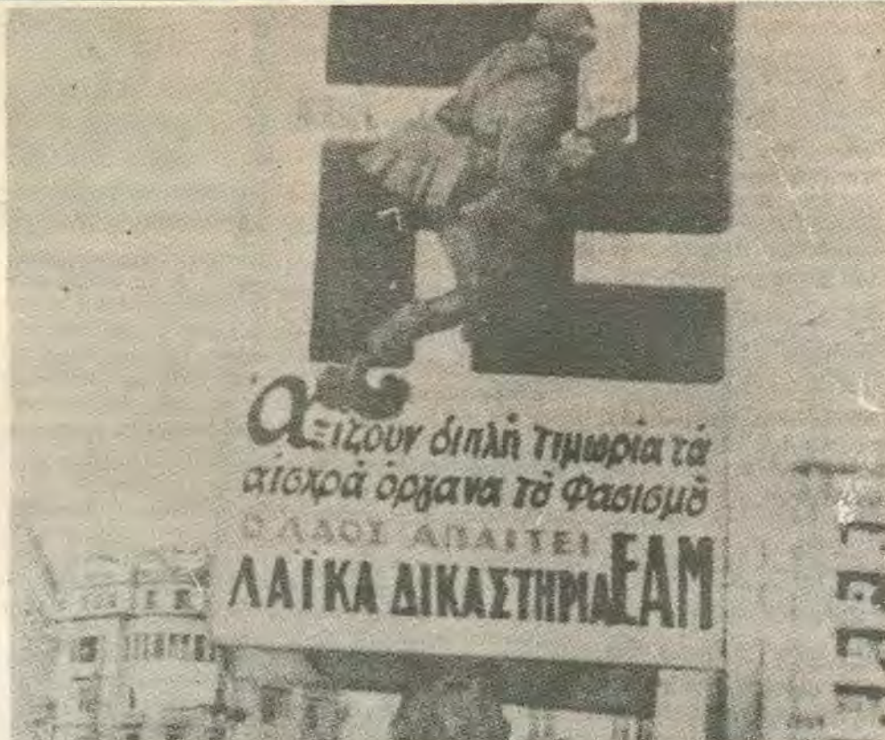
Πλακατ των ημερων της απολευθέρωσης. Ο λαός ζητά Λαϊκά Δικαστήρια. Την ίδια στιγμή το Κ.Κ.Ε. υποτάσσεται στον Γ. Παπανδρέου και στον Τσούρατλη. Οι δοολογοι και οι ταγμασφαλίτες επιβάνουν και περουν στην επέτειω.

Λιμένων κ.α. Τα προβλήματα είναι κοινά. Σήμερα είναι αφθοί, άβριο θα ακολουθήσουν και οι άλλοι κλάδοι. Αν χάσει την μάχη έστω και ένας το μέας η εργοδοσία θα κτυπήσει και στους υπόλοιπους. Η εργατική τάξη πρέπει να δώσει δυναμική απάντηση στην εργοδοσία. Αν επιμένουν στες απόψεις τους να κατέβει σε παναπεργίες, κάνοντας ξεκάρθαρα στους εργοδότες ότι δεν είναι καθόλου διαθετημένοι να φορτωθούν για μια ακόμη φορά τα βάρη της κρίσης. Την δύναμη που έχει σήμερα το εργατικό κίνημα αν οι ηγεσίες των συνδικατών την χρησιμοποιήσαν σωστα σίγουρα θα νικήσουν. ΑΧΙΛΛΕΑΣ ΑΧΙΛΛΕΩΣ