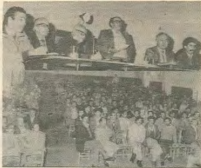
Γενική συνέλευση των Αμιαντορυχών

Η αγορά του Αμιαντορυχείου από την Μητρόπολη Λεμεσού, έγινε κατόπιν κυβερνητικής ενθάρρυν-