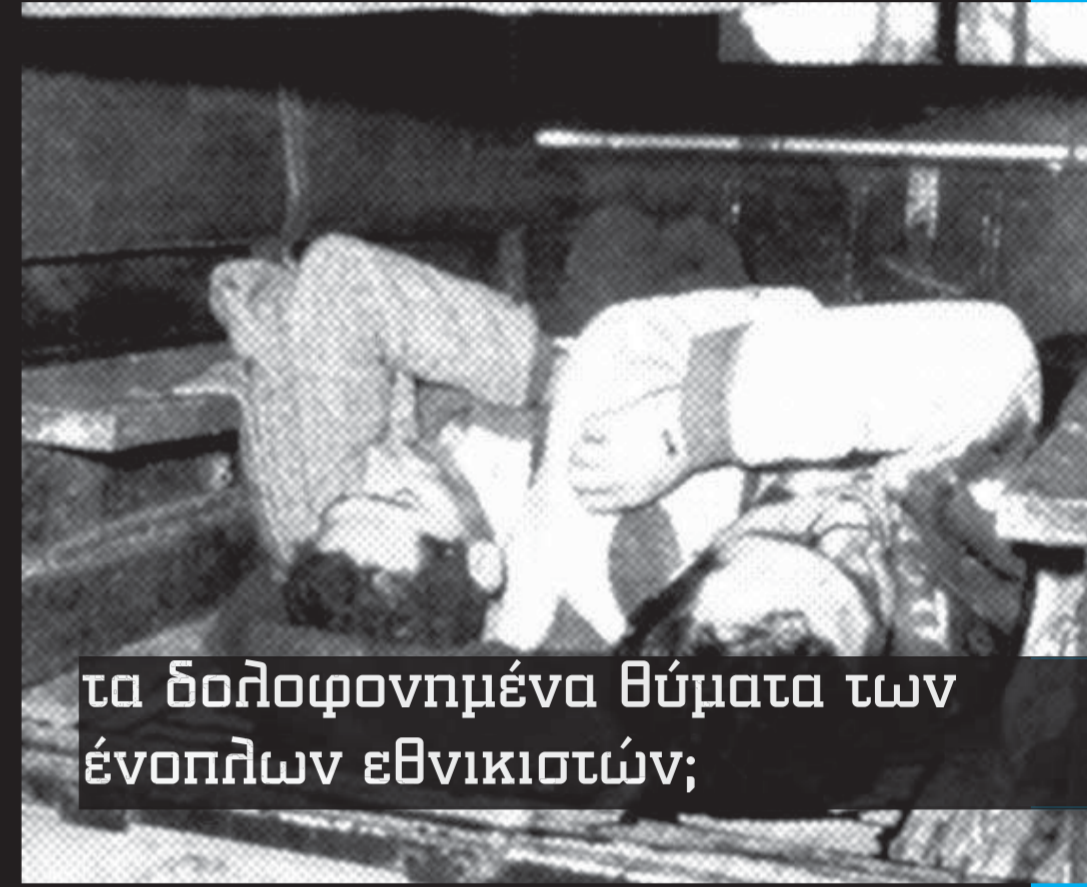
τα δολοφονημένα θύματα των ένοπλων εθνικιστών;